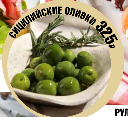
СИЦИЛИЙСКИЕ ОЛИВКИ 325р