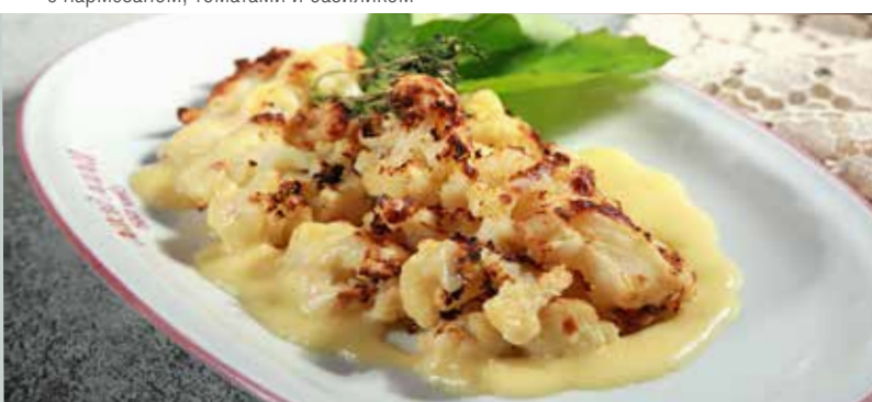
ЗАПЕЧЕННАЯ ЦВЕТНАЯ КАПУСТА 295₹ под сливочно-сырным соусом