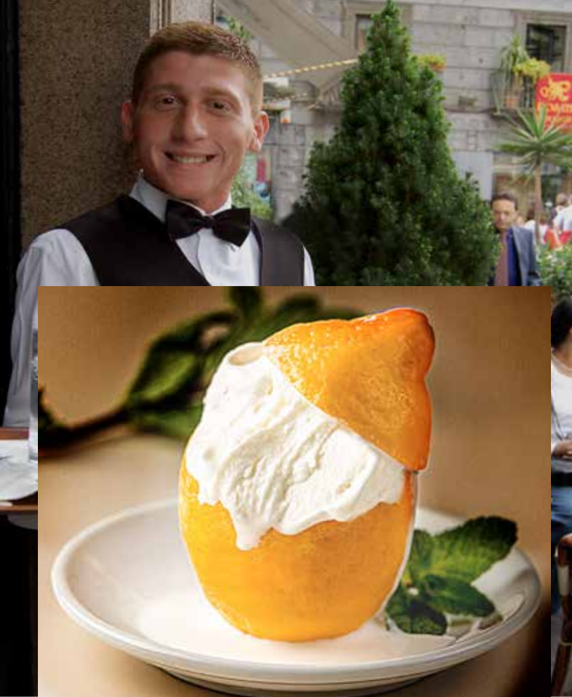
SORBETTO AL LIMONE 295₺ лимонный сорбет