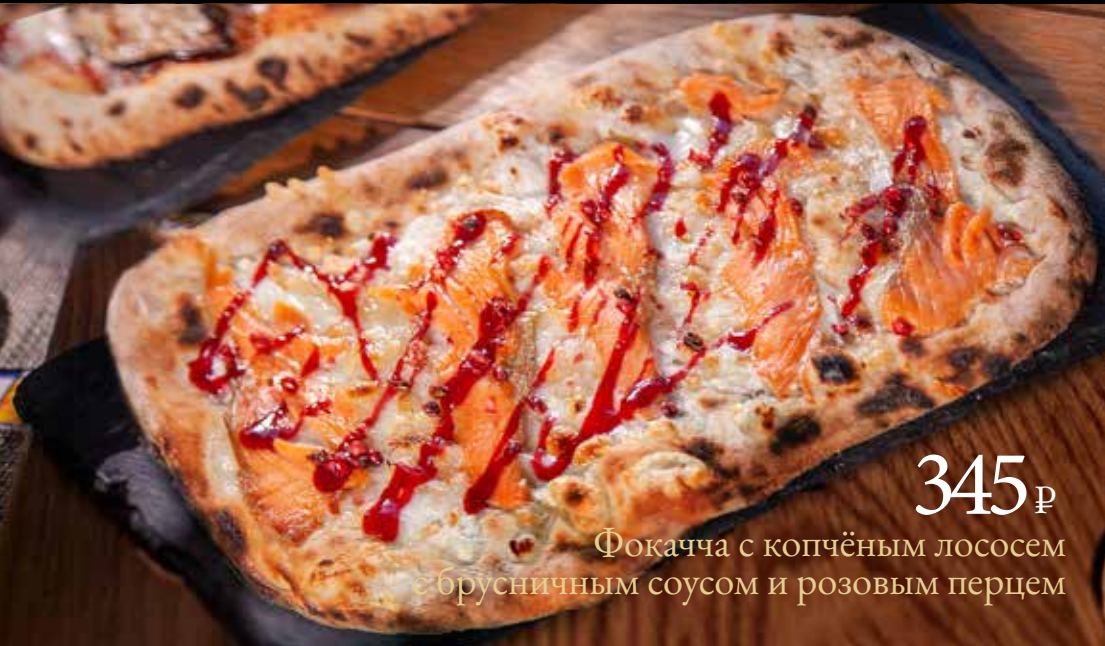
345 р Фокачча с копчёным лососем и брусничным соусом и розовым перцем