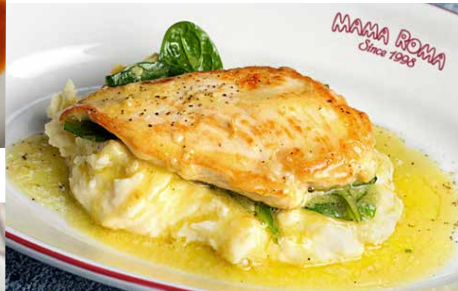
КУРИНОЕ ФИЛЕ С КАРТОФЕЛЬНЫМ ПЮРЕ шпинатом и соусом Бёрблан