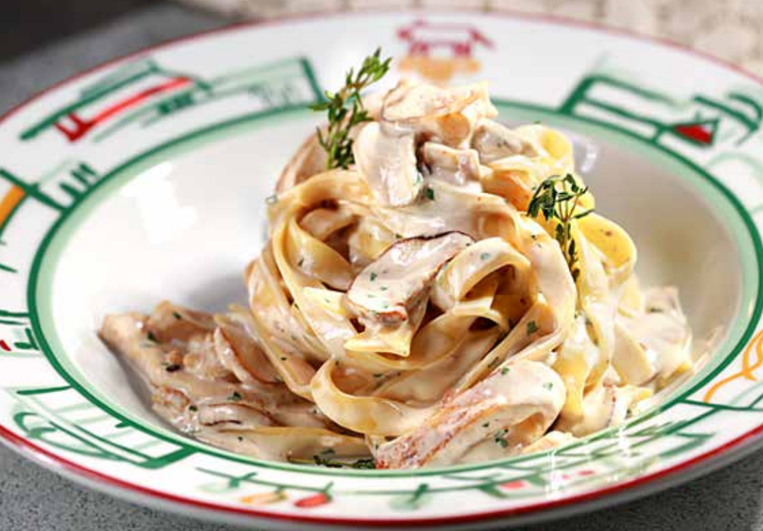
ТАЛЬЯТЕЛЛЕ С КУРИНЫМ ФИЛЕ лесными грибами в сливочном соусе 495р