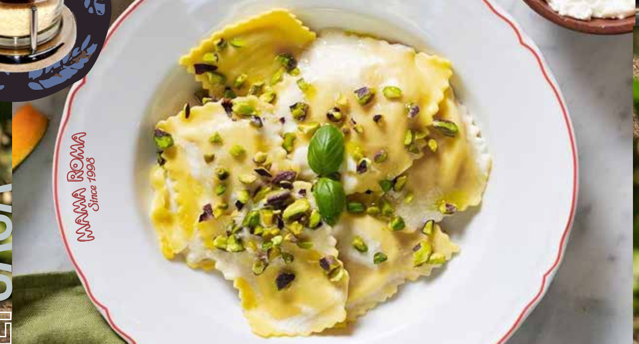
ДОМАШНИЕ РАВИОЛИ С РИКОТТОЙ в соусе из сливочного масла с фисташками 425р