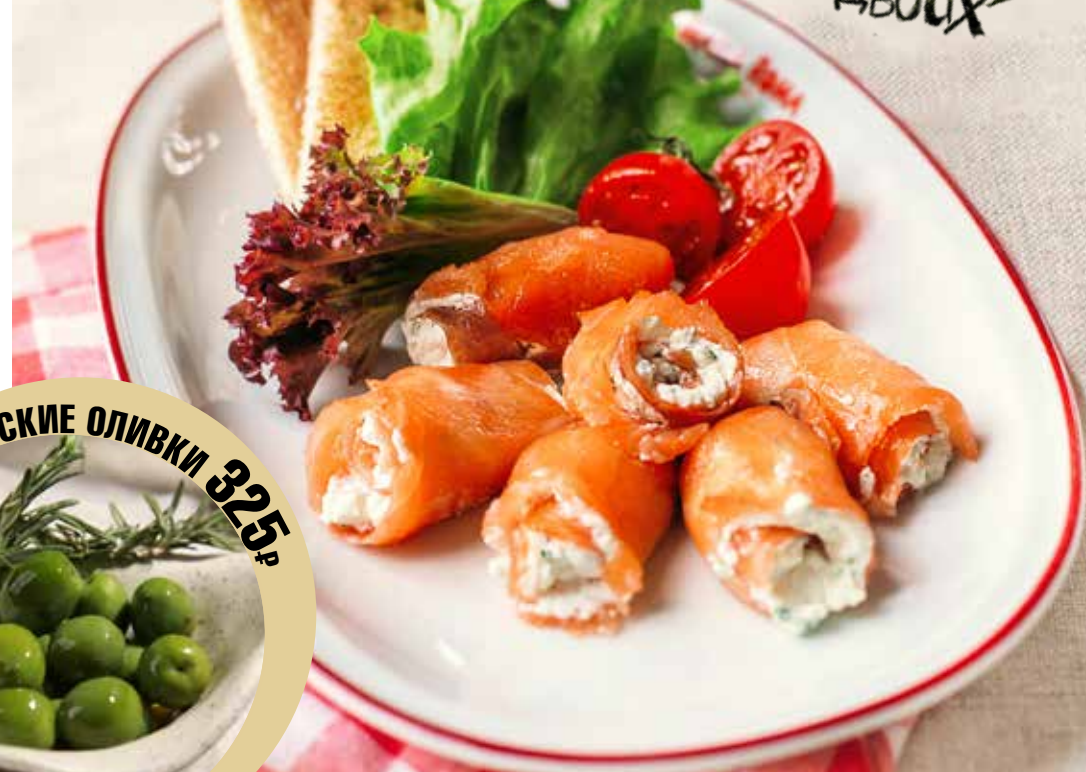
РУЛЕТКИ ИЗ КОПЧЕНОГО ЛОСОСЯ 595р с рикоттой