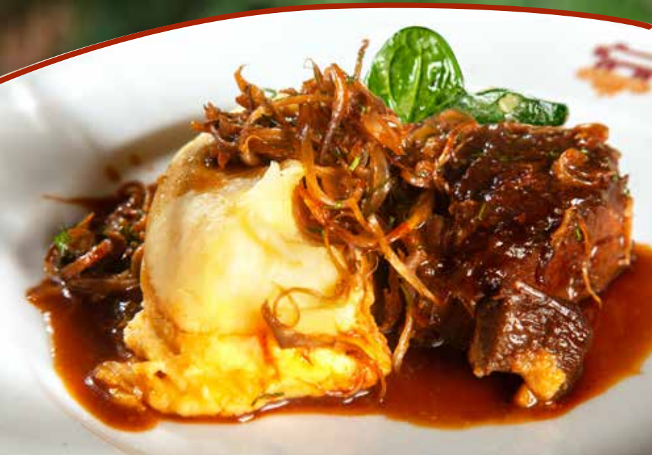
ГОВЯЖЬИ ЩЁЧКИ с нежным картофельным пюре и соусом из красного вина