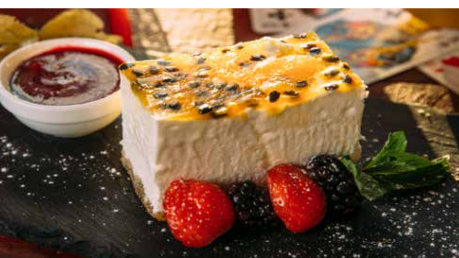
ЧИЗКЕЙК С МАРАКУЙЕЙ с малиновым соусом и сезонными ягодами 325 р