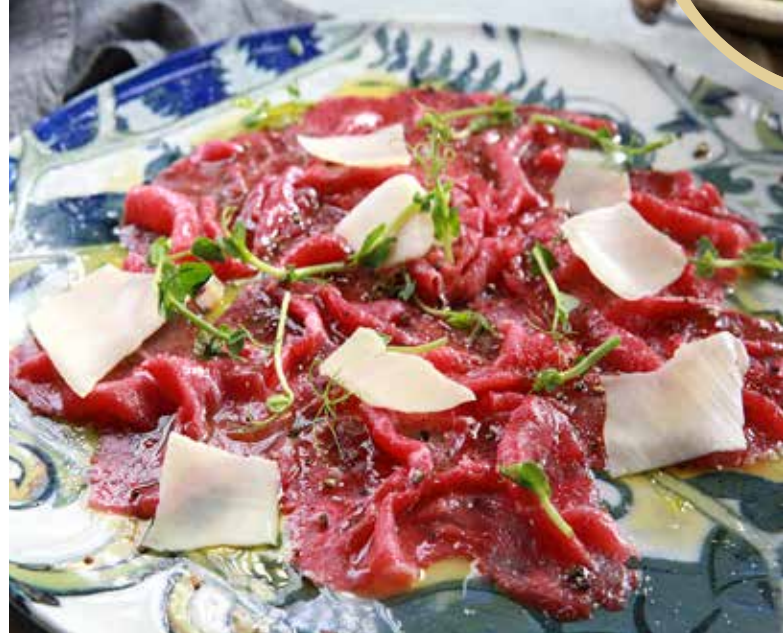
CARPACCIO карпаччо из говядины с пармезаном 455р