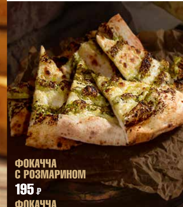
ФОКАЧЧА С РОЗМАРИНОМ 195 р ФОКАЧЧА С СОУСОМ ПЕСТО 225 р