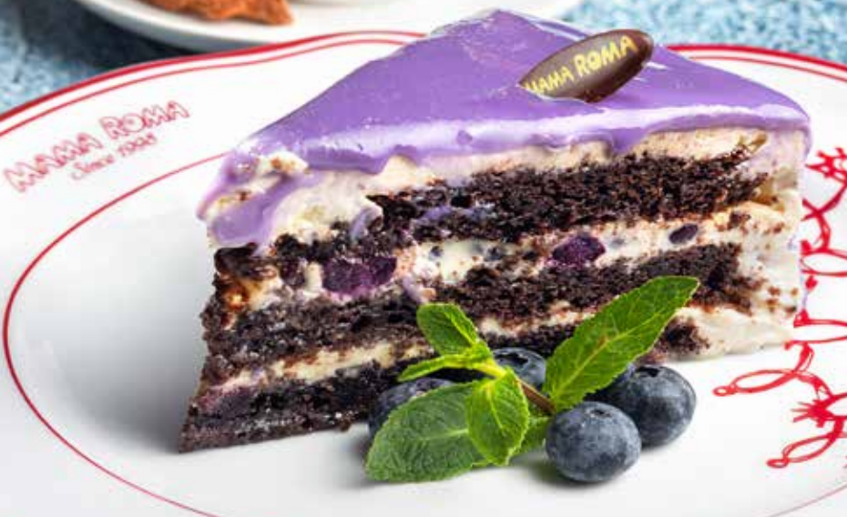
ЧЕРЁМУХОВЫЙ ТОРТ 345 р