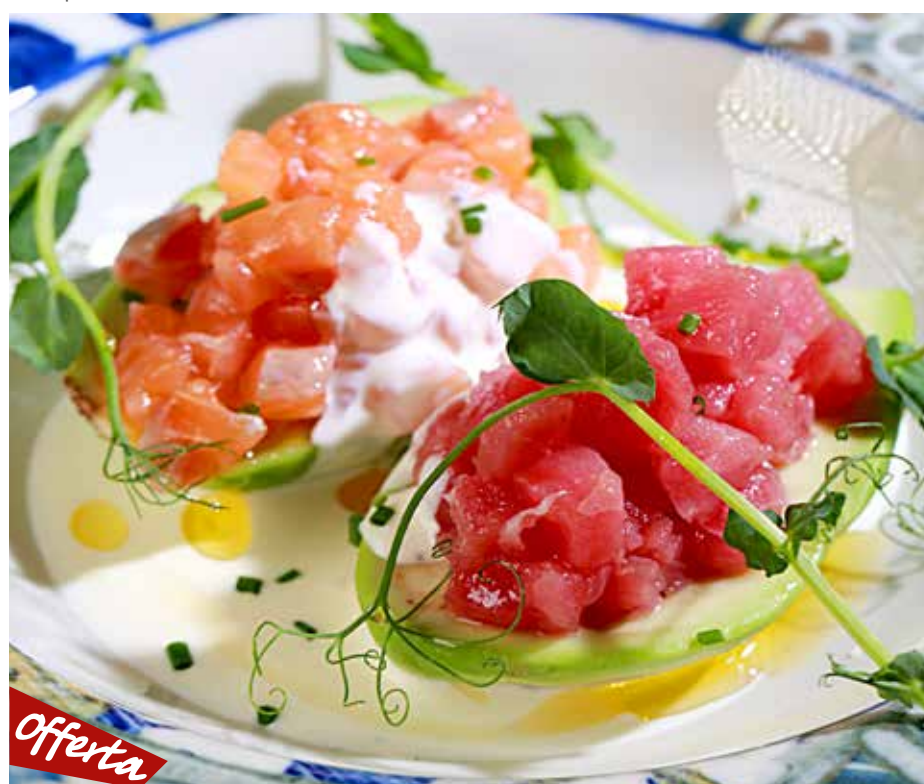
АВОКАДО С ТАРТАРОМ ИЗ ТУНЦА И ЛОСОСЯ 495₽ и соусом Горгонзола