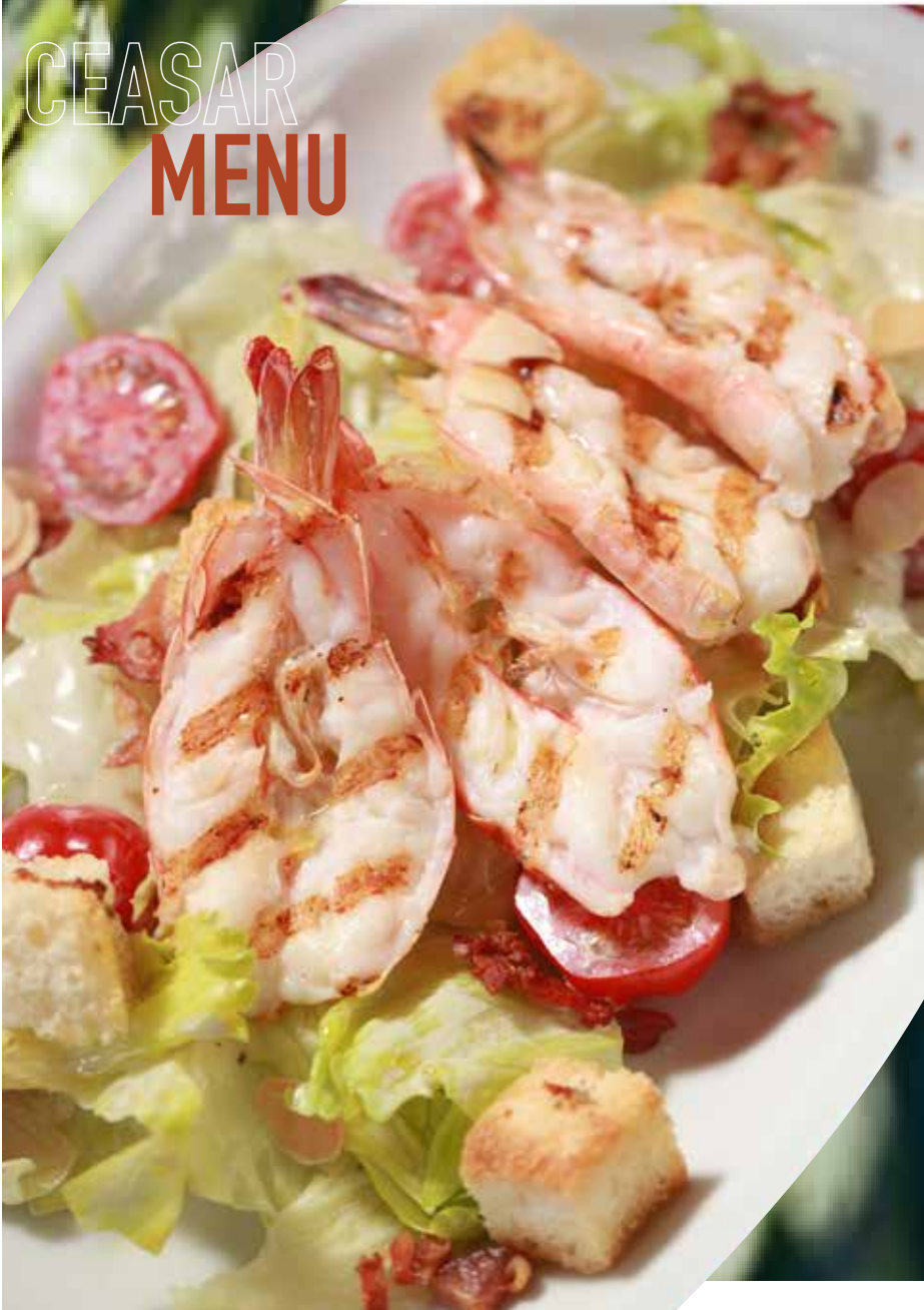
ЦЕЗАРЬ С КУРИЦЕЙ 425₽ ЦЕЗАРЬ С КРЕВЕТКАМИ 495₽ креветки на гриле, листья салата айсберг, помидоры черри, хрустящие сухарики, бекон, насыщенный соус Цезарь и лепестки миндаля