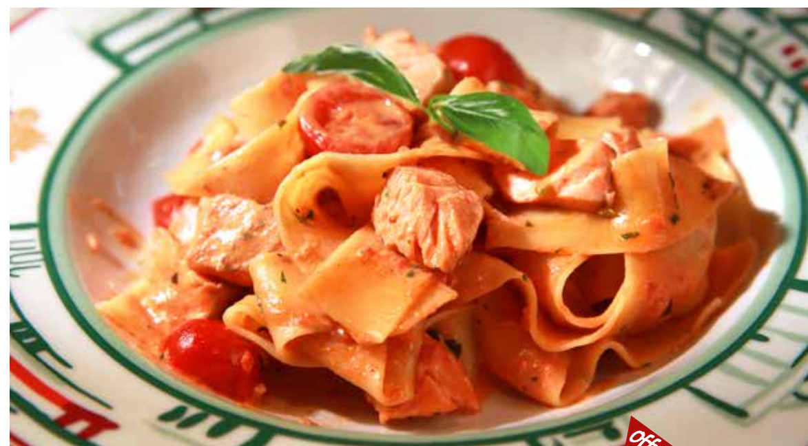
ПАППАРДЕЛЛЕ С ЛОСОСЕМ с базиликом, итальянскими травами, оливками, помидорами черри в сливочном соусе 495р