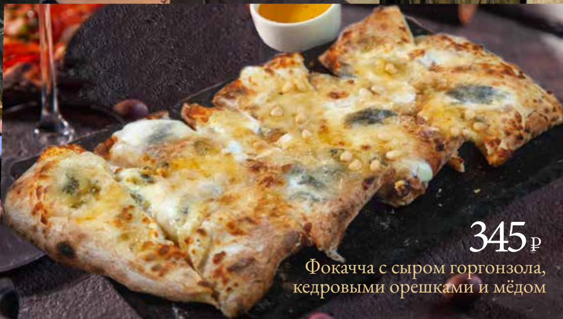
345 р Фокачча с сыром горгонзола, кедровыми орешками и мёдом