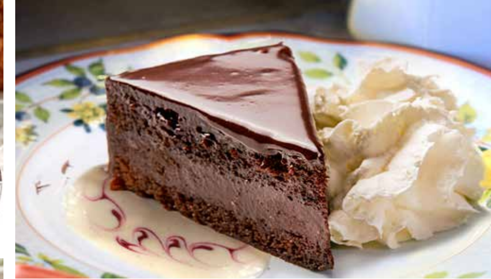
ЗАХЕР 355 р