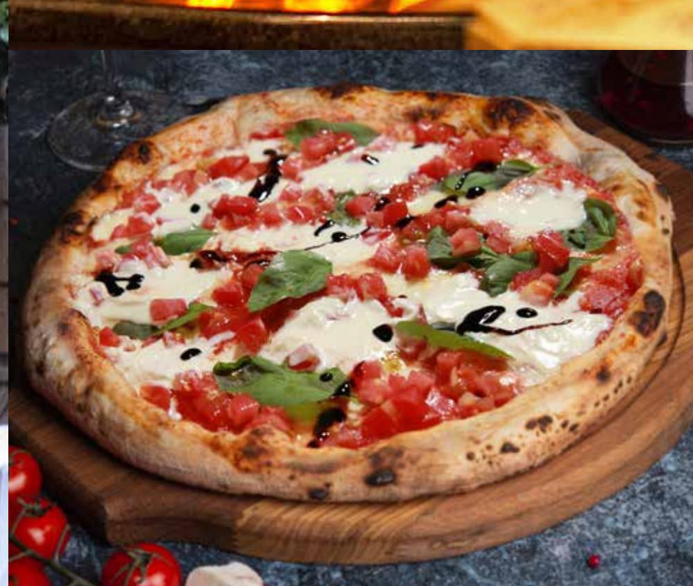
ПИЦЦА С НЕЖНОЙ СТРАЧАТЕЛЛОЙ И ТОМАТАМИ базиликом и бальзамическим соусом Modena