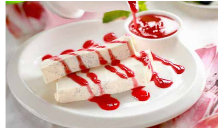
ПАННА КОТТА 315 р