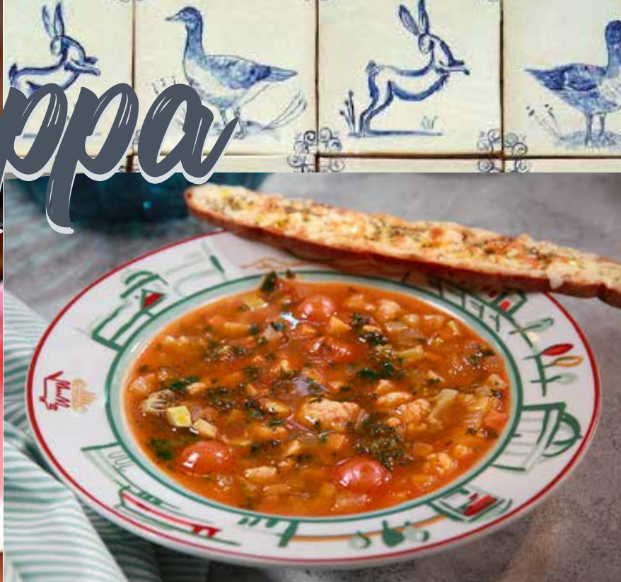
Минестроне овощной пряный суп с соусом Наполи 285₹