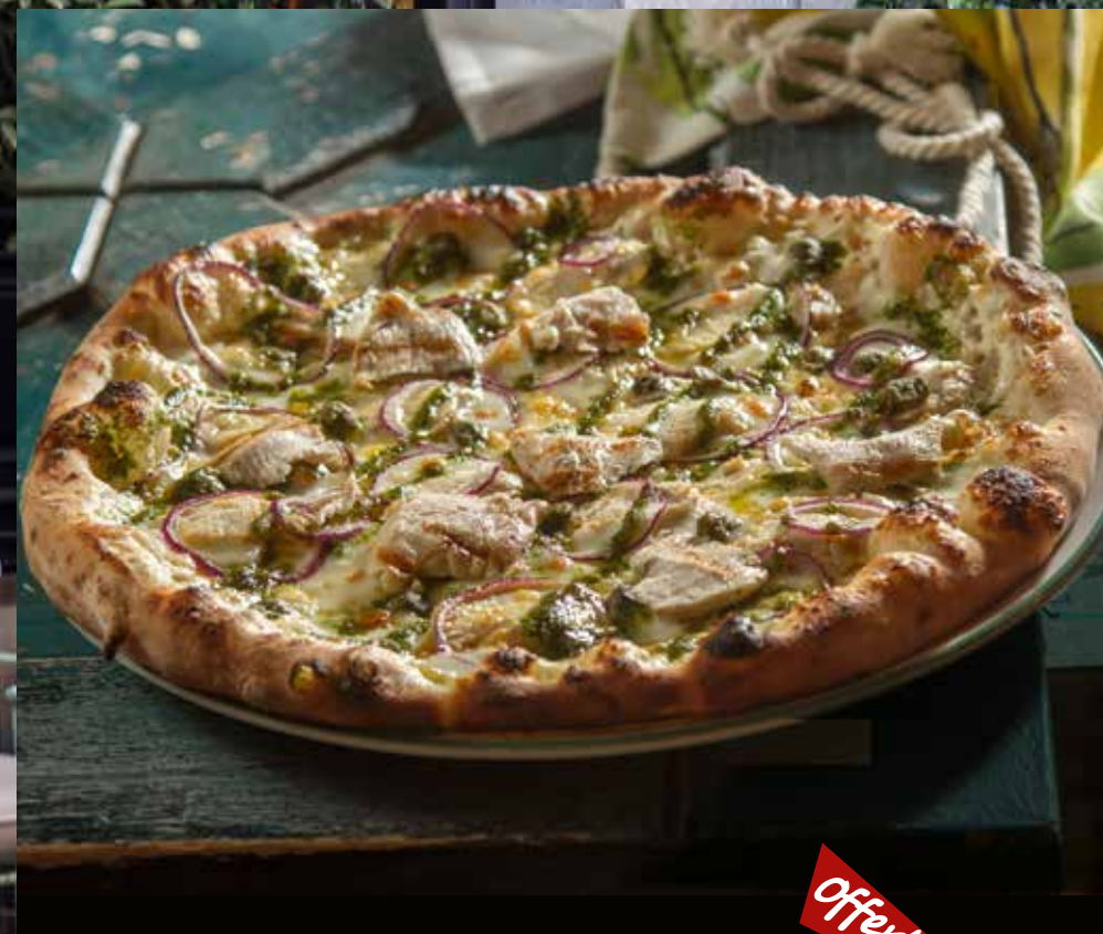
ЦЕЗАРЬ курица, соус Песто, соус Цезарь, каперсы, лук красный