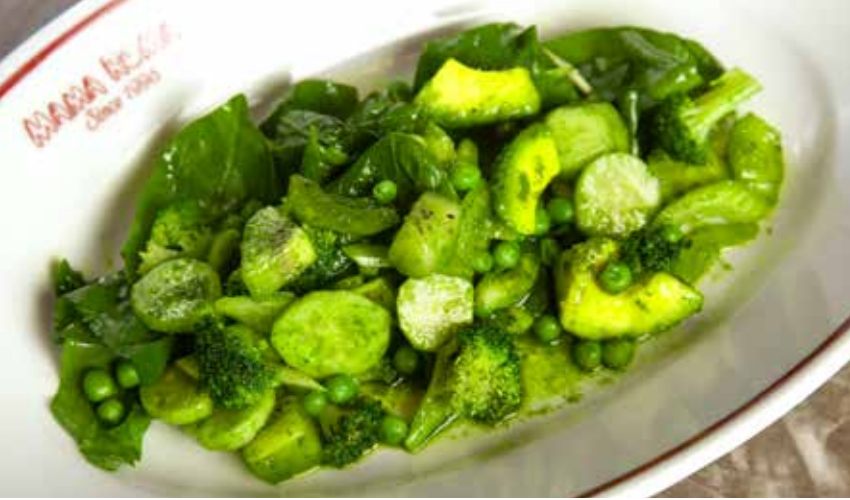
ЗЕЛЕНЬЙ САЛАТ С АВОКАДО И КИВИ шпинат, зеленый горошек, огурец, сельдерей с соусом из шпината и тархуна 355р