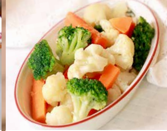
ОВОЩИ НА ПАРУ 230₹