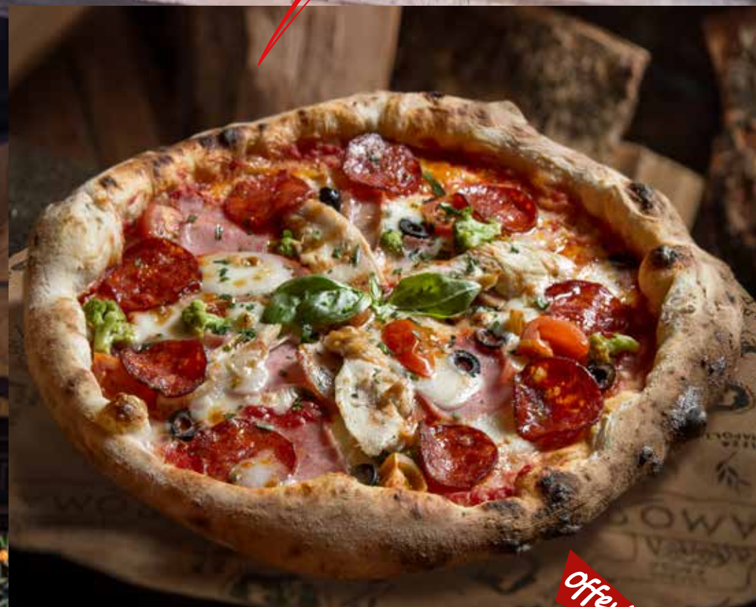
МАМА РОМА домашний бекон, салями, куриное филе, брокколи, маслины и помидоры черри