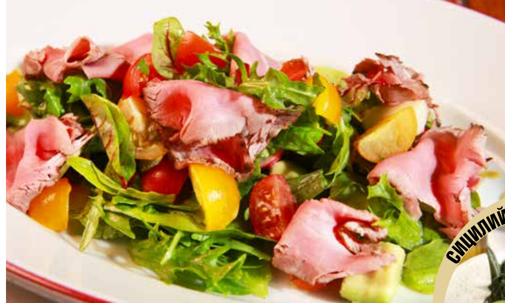
ЗЕЛЕНЬЙ МИКС САЛАТ С НЕЖНЫМ РОСТБИФОМ черри и соусом Вителло Тоннато 545р