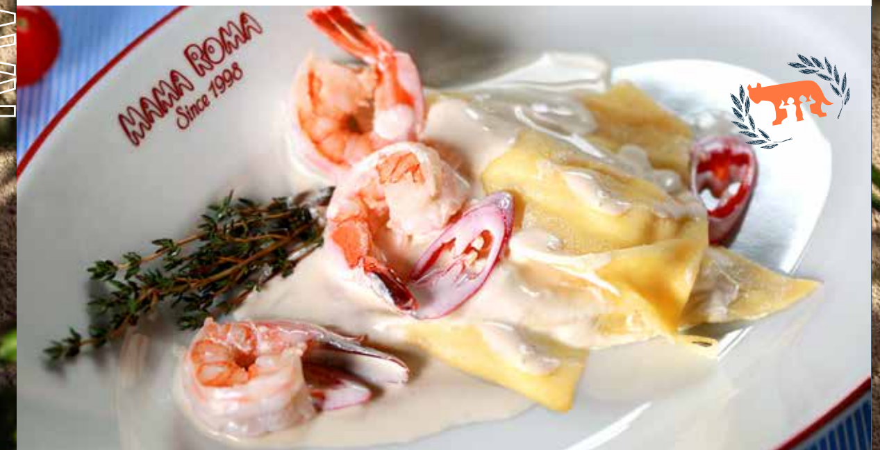
РАВИОЛИ ГРАНДЕ С ТИГРОВЫМИ КРЕВЕТКАМИ с рикоттой в сливочном соусе 475р