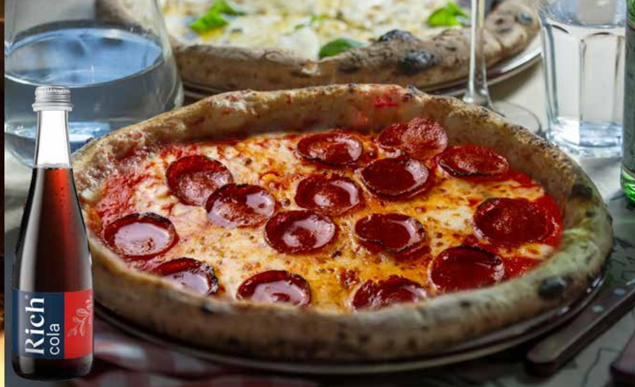
ПЕППЕРОНИ салами, томаты, сыр моцарелла