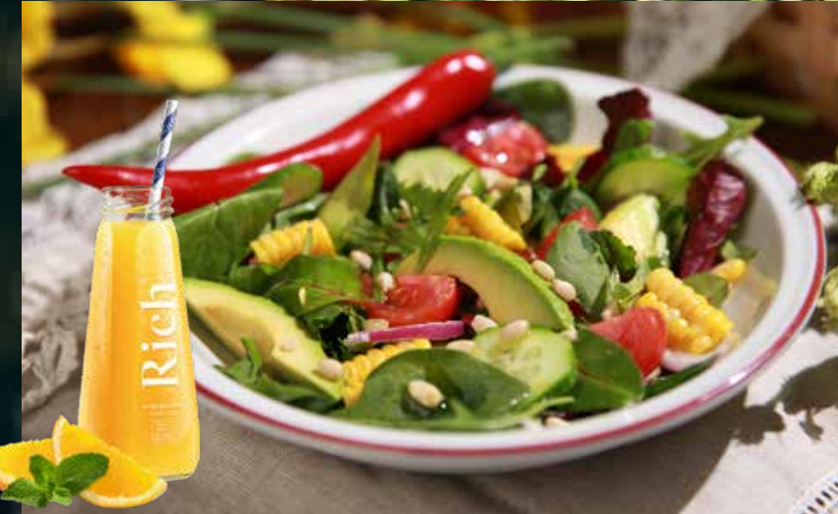
INSALATA FRESCA 325₽ салат из свежих овощей с авокадо и оливковым маслом Extra Virgin