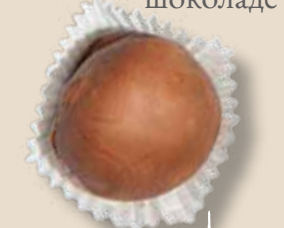
Грильяж с кедровым орехом