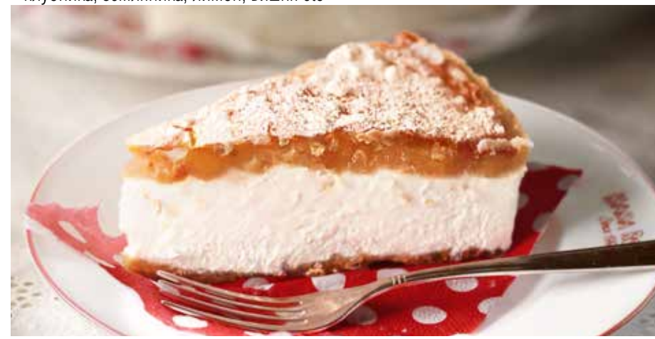
РИКОТТА С ГРУШЕЙ 335 р