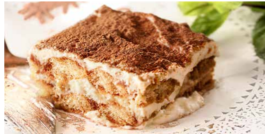
ТИРАМИСУ 295 р