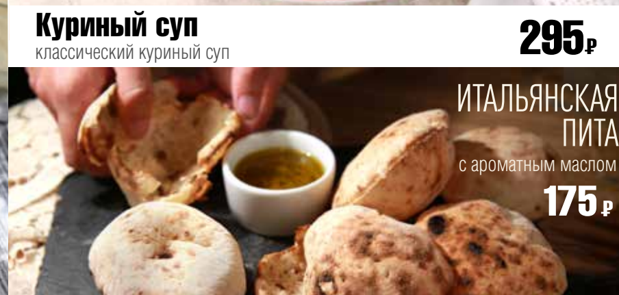
ИТАЛЬЯНСКАЯ ПИТА с ароматным маслом 175₹