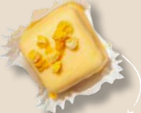
Манго в апельсиновом шоколаде