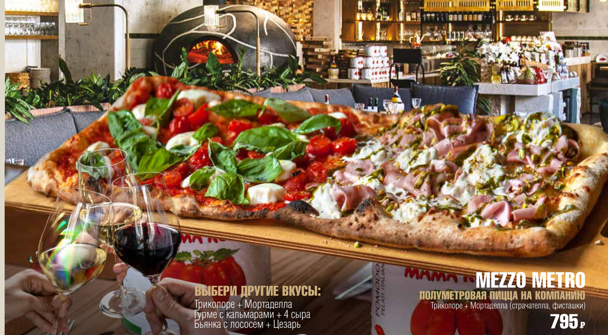
ВЫБЕРИ ДРУГИЕ ВКУСЫ: Триколоре + Мортаделла Гурме с кальмарами + 4 сыра Бьянка с лососем + Цезарь