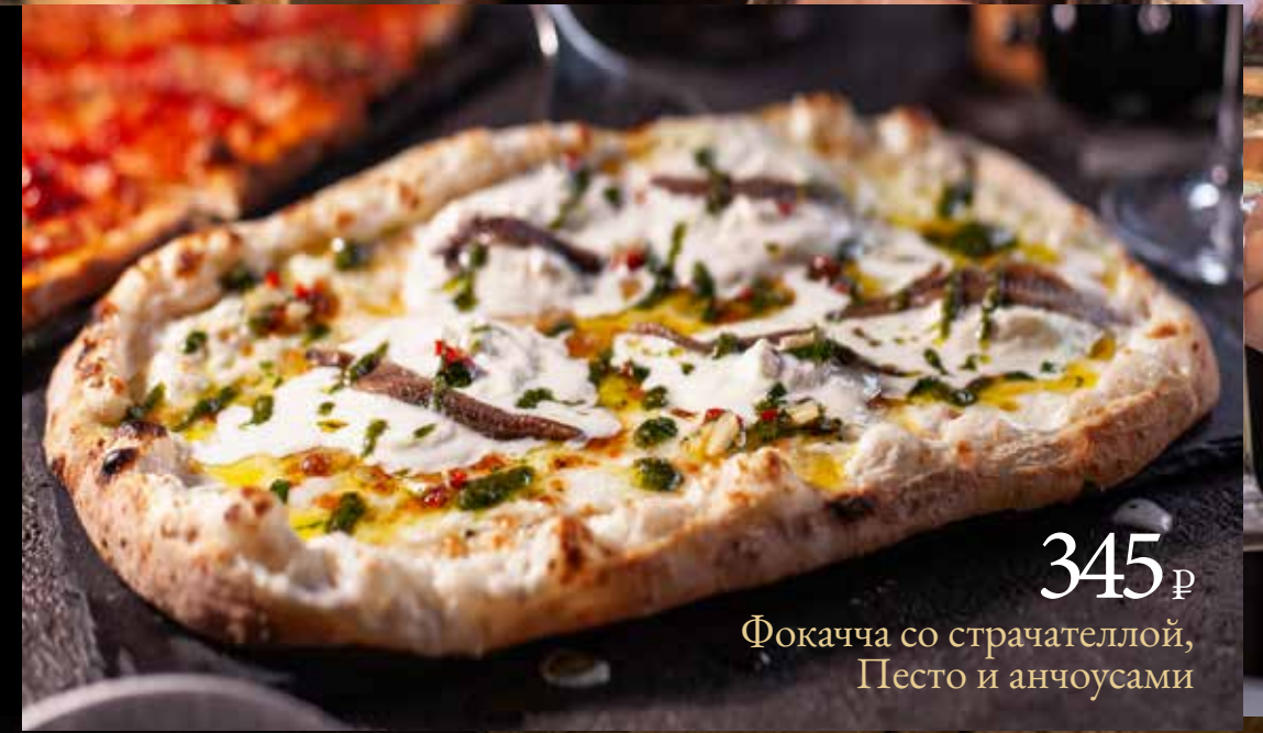
345 р Фокачча со страчателлой, Песто и анчоусами