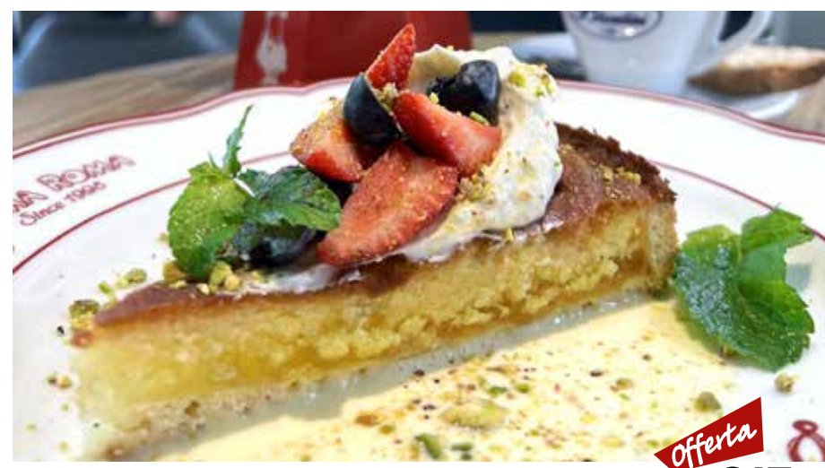
TORTA DI NONNA с кремом из маскарпоне с фисташками 315 р

Сезонные начинки: (уточняйте у официанта) клубника, земляника, лимон, вишня etc