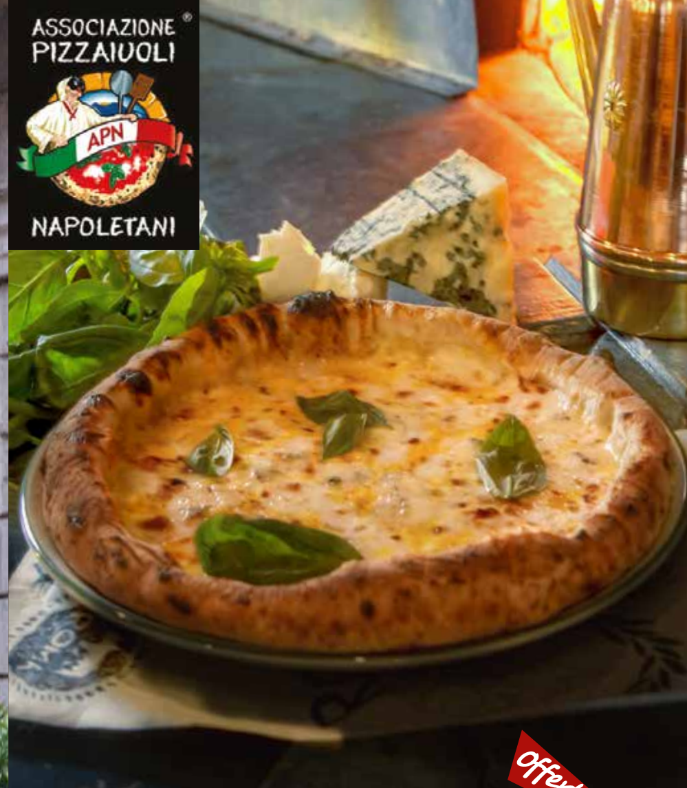
БЬАНКА ЧЕТЫРЕ СЫРА сливочный соус, моцарелла, пармезан, горгонзола, эмменталь