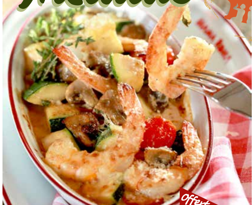
ГАМБЕРЕТТИ АЛЬ ФОРНО запеченные тигровые креветки в сливочном соусе с пармезаном, цукини и грибами 545р