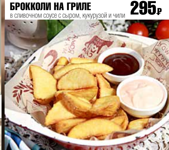
PATATE DI CASA 215₹ картофель по-деревенски с двумя соусами