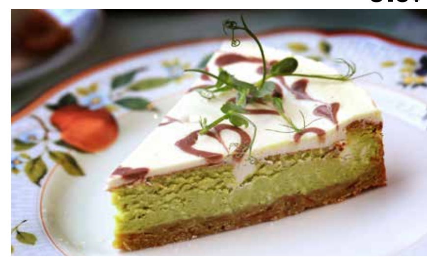
ФИСТАШКОВЫЙ ЧИЗКЕЙК 365 р

Сезонные начинки: (уточняйте у официанта) клубника, земляника, лимон, вишня etc