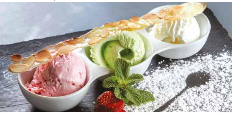
МОРОЖЕНОЕ «ТРЕ АМИЧИ» 315 р