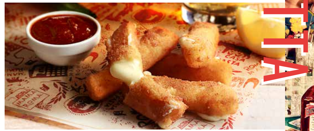
НЕЖНАЯ МОЦАРЕЛЛА В ХРУСТЯЩЕЙ КОРОЧКЕ с соусом Mama Roma 375р