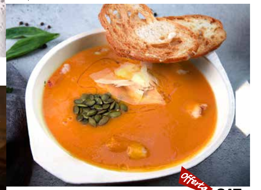
Тыквенный крем-суп с пармезаном и тигровыми креветками 315₹ 445₹ offerta