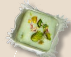
Фисташка в лаймовом шоколаде