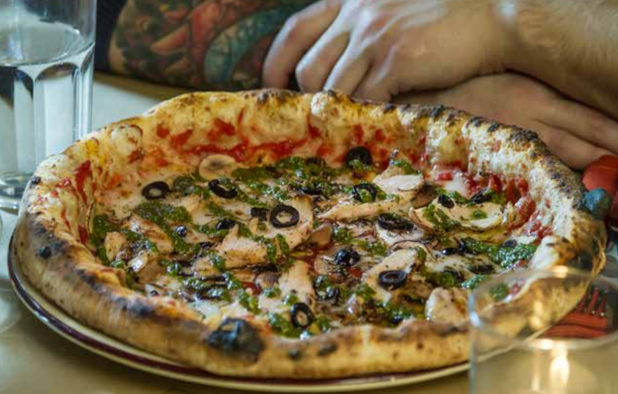
ПОЛЛО ПЕСТО куриное филе, соус Песто, грибы, черные оливки, томаты, сыр моцарелла