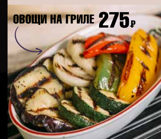
ОВОЩИ НА ГРИЛЕ 275 р