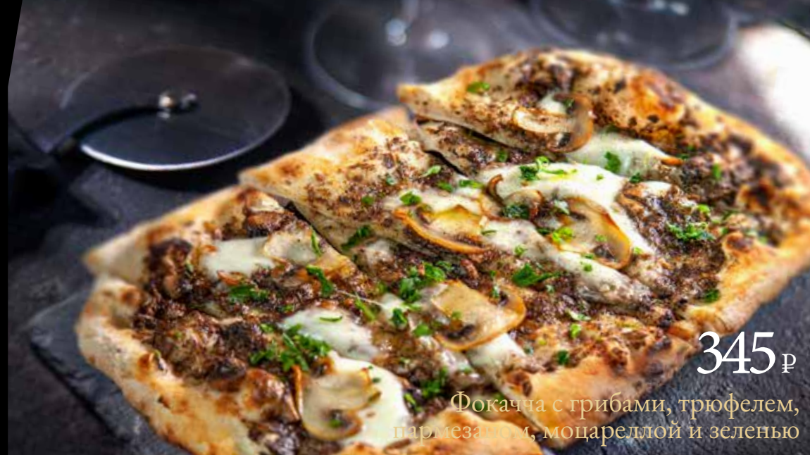
345 р Фокачча с грибами, трюфелем, пармезаном, моцареллой и зеленью