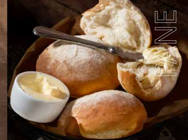
ИТАЛЬЯНСКИЙ ХЛЕБ со сливочным маслом 175 р