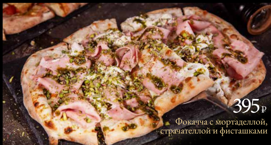
395 р Фокачча с мортаделлой, страчателлой и фисташками