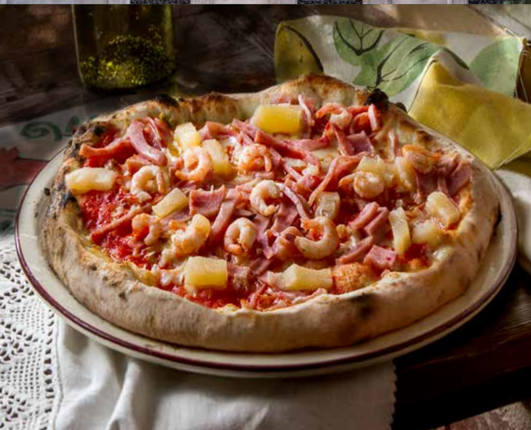
ЭКЗОТИКА креветки, ананас, ветчина, томаты, сыр моцарелла