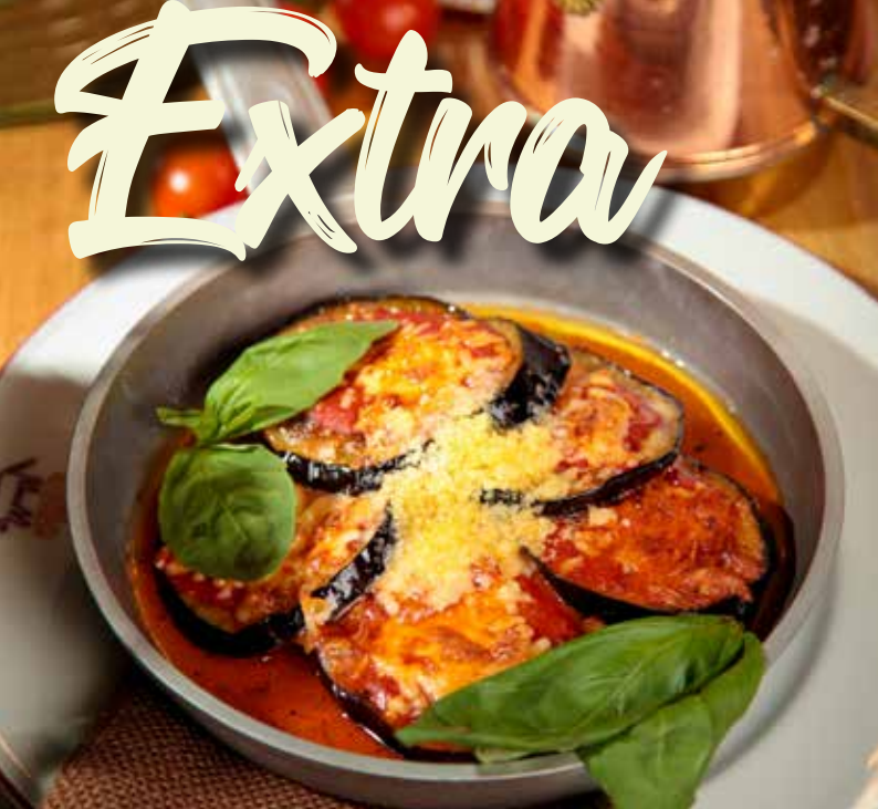
ЗАПЕЧЕННЫЕ БАКЛАЖАНЫ 345₹ с пармезаном, томатами и базиликом