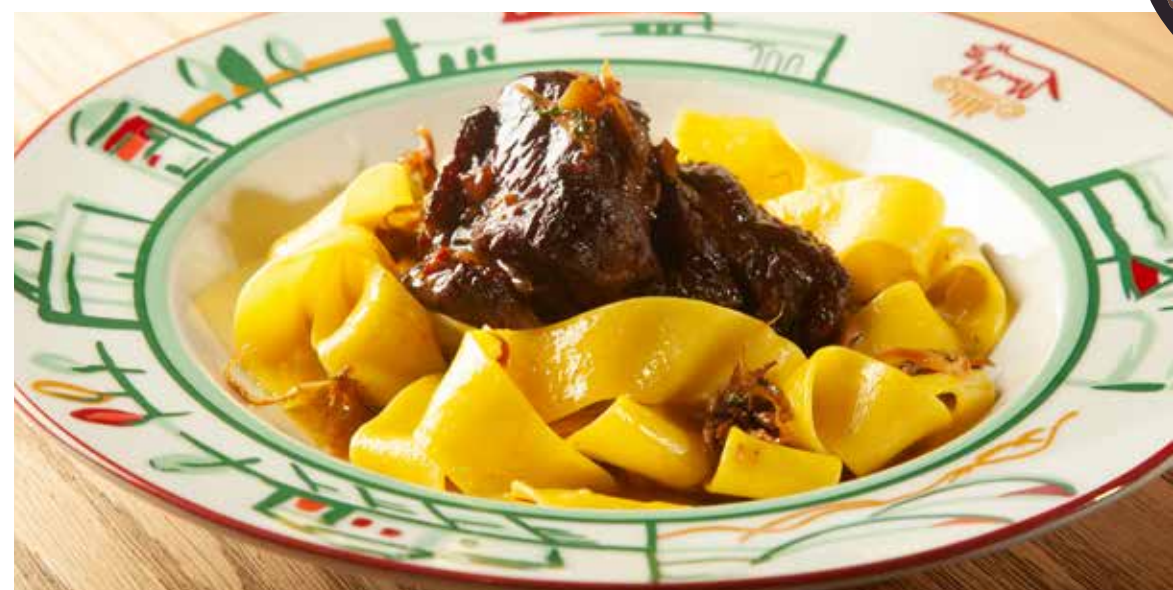
ПАППАРДЕЛЛЕ МИЛАНЕЗЕ С РАГУ ИЗ ЩЕЧЕК и шафрановым маслом 425р