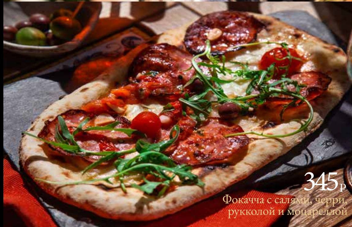
345 р Фокачча с саями, черри, рукколой и моцареллой