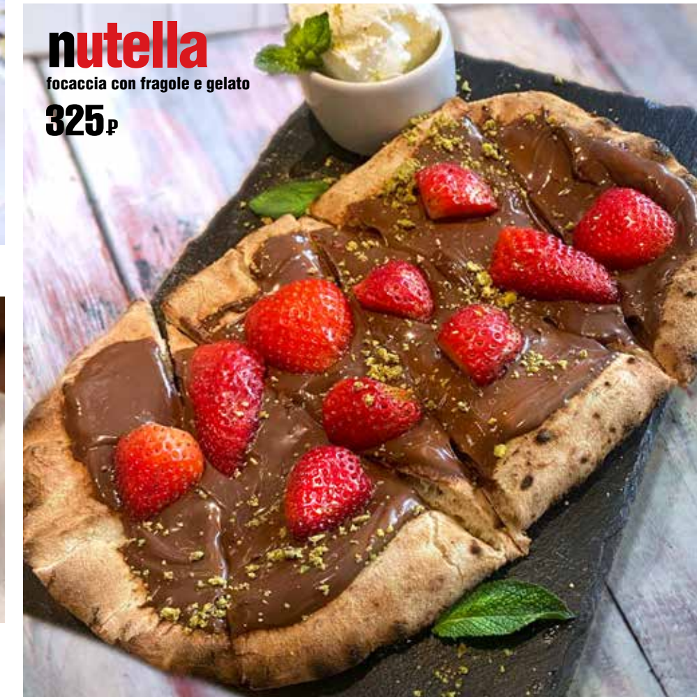
nutella focaccia con fragole e gelato 325 р