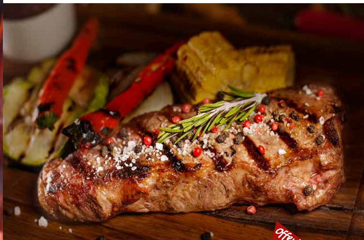
СТЕЙК СТРИПЛОЙН с овощами на гриле