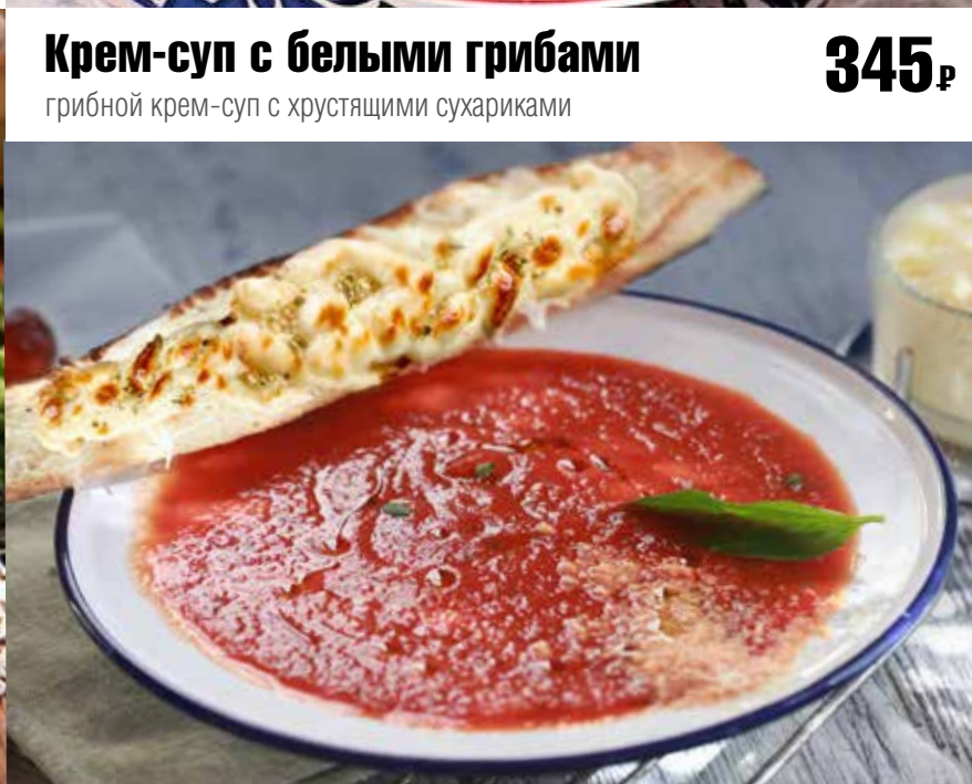
Томатный суп с поджаренным тостом и сыром моцарелла 375₹