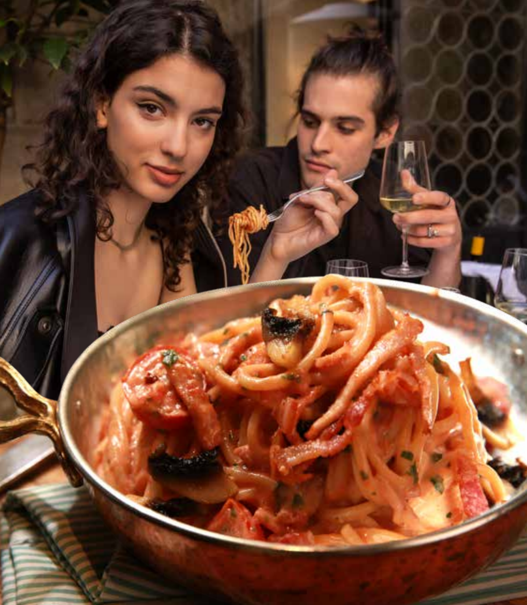
ПАСТА МАРИЯ бекон, ветчина, грибы, помидоры черри, сливочно-томатный соус 425р