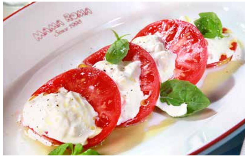
КАПРЕЗЕ нежная страчателла с бакинскими помидорами, оливковым маслом Extra Virgin и базиликом 425р