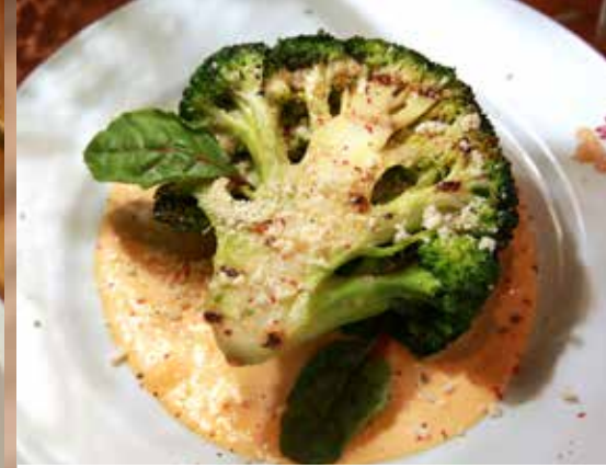
БРОККОЛИ НА ГРИЛЕ 295₹ в сливочном соусе с сыром, кукурузой и чили