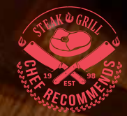
СОЧНЫЙ СТЕЙК ИЗ СВИНИНЫ с картофелем и розмарином