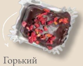
Горький шоколад с имбирем