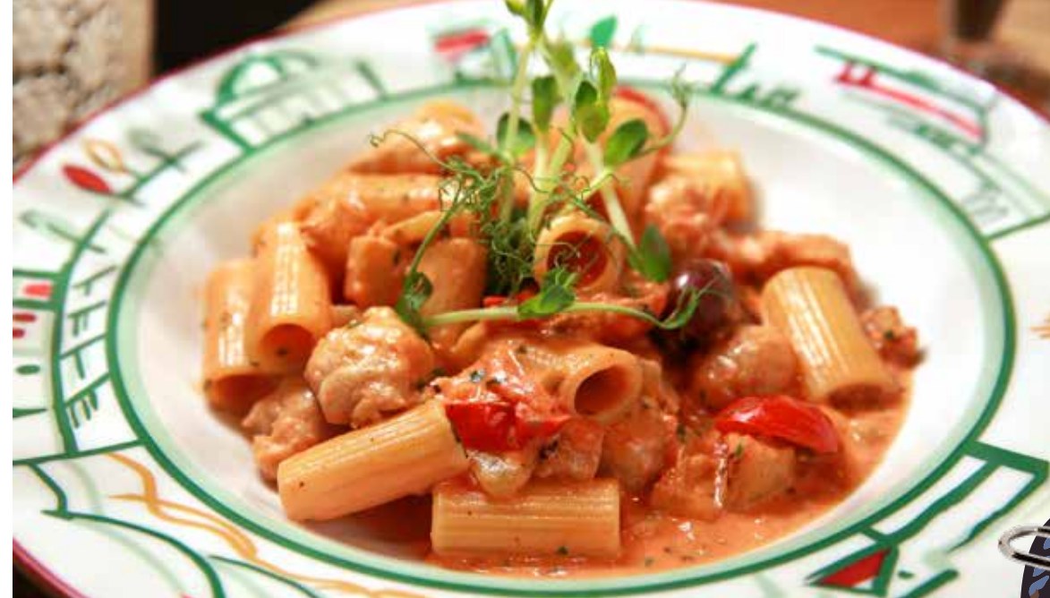
РИГАТОНИ С САЛЬСИЧЧЕЙ оливками в сливочно-томатном соусе 405р