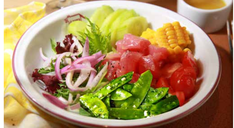
КРУДО ИЗ ТУНЦА С АПЕЛЬСИНОМ И МЕДОВОЙ ГОРЧИЦЕЙ 475р с молодым стручковым горошком, черри, кукурузой, свежим огурцом и миксом салатов