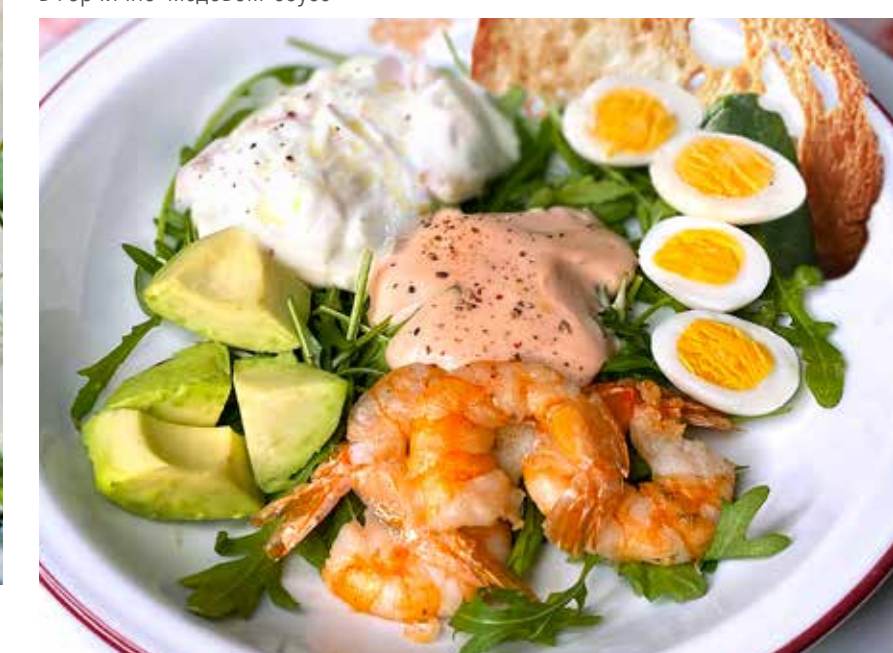
САЛАТ С КРЕВЕТКАМИ, АВОКАДО И СТРАЧАТЕЛЛОЙ 495₽ нежной страчателлой, рукколой, перепелиными яйцами и соусом Капри