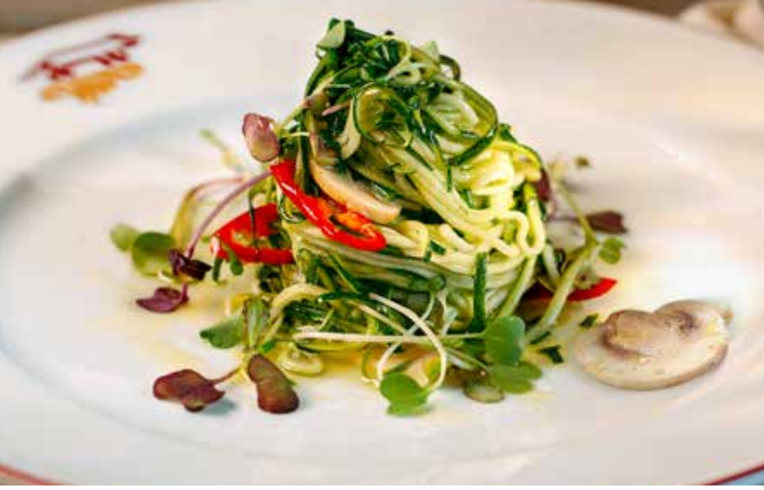
САЛАТ ИЗ ЦУКИНИ цукини, шампиньоны, оливковое масло, перец чили 295р