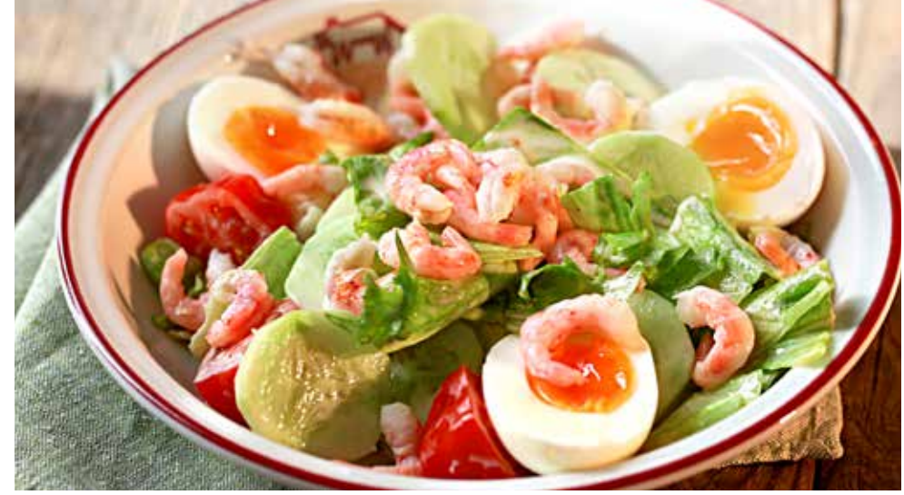
КАПРИ салат айсберг, креветки, огурцы, помидоры черри, яйца, соус Капри 475р