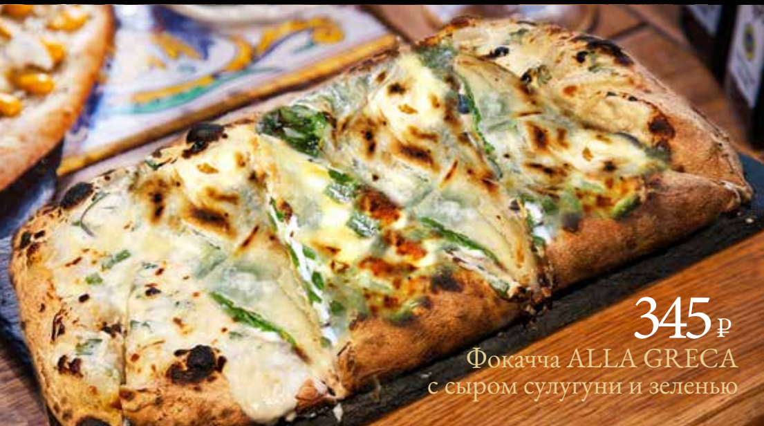
345 р Фокачча ALLA GRECA с сыром суłгуни и зеленью