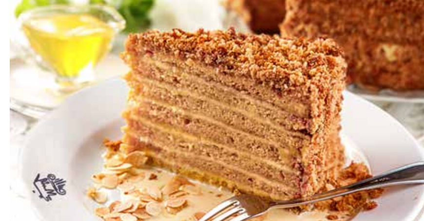
МЕДОВИК с ванильным соусом 345 р