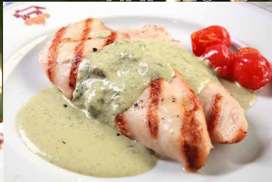
КУРИНОЕ ФИЛЕ НА ГРИЛЕ с сыром горгонзола в соусе Песто