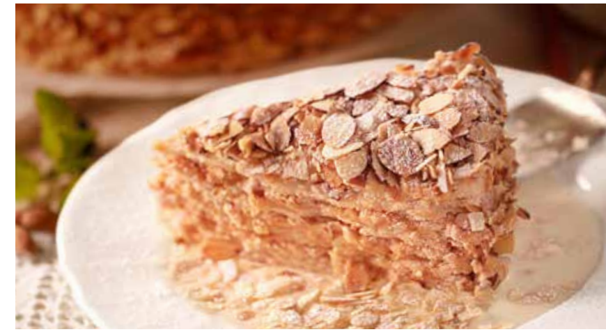
МИНДАЛЬНЫЙ ТОРТ 395 р