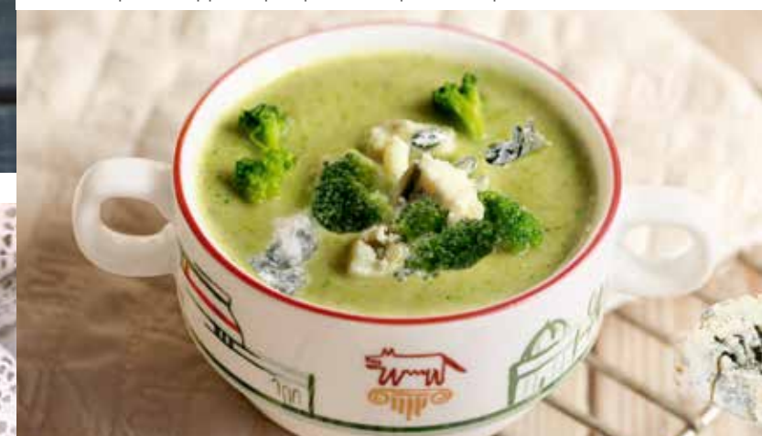
Суп-пюре из брокколи с горгонзоллой 295₹