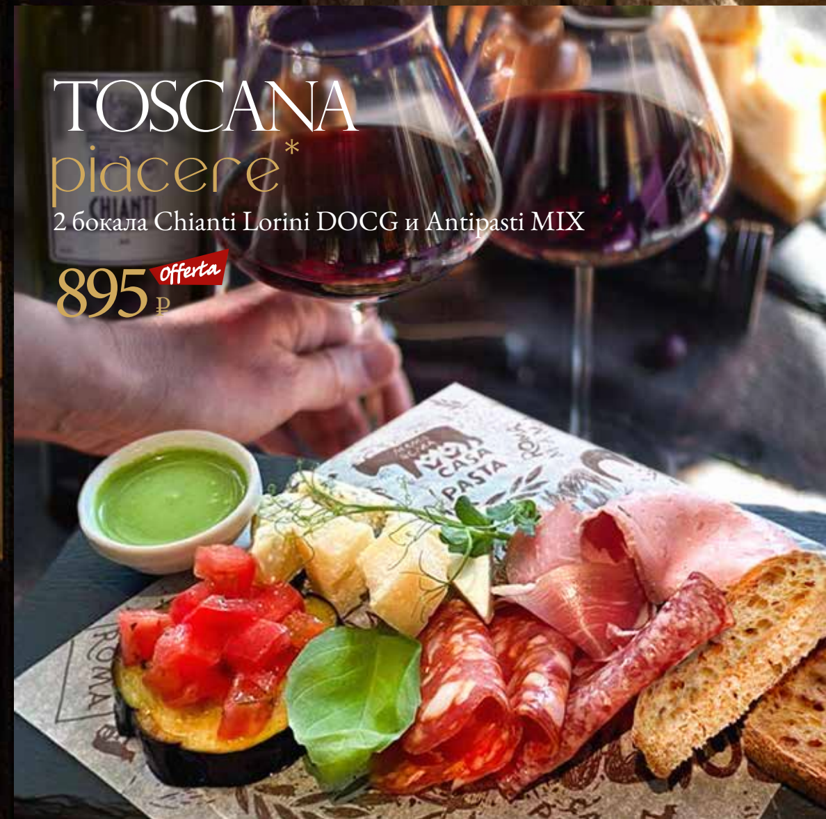
Antipasti MIX 395 р *Грана падано, пекорино, прошутто, саями, баклажан с тар-таром из бакинских томатов, кростини, соус из рукколы