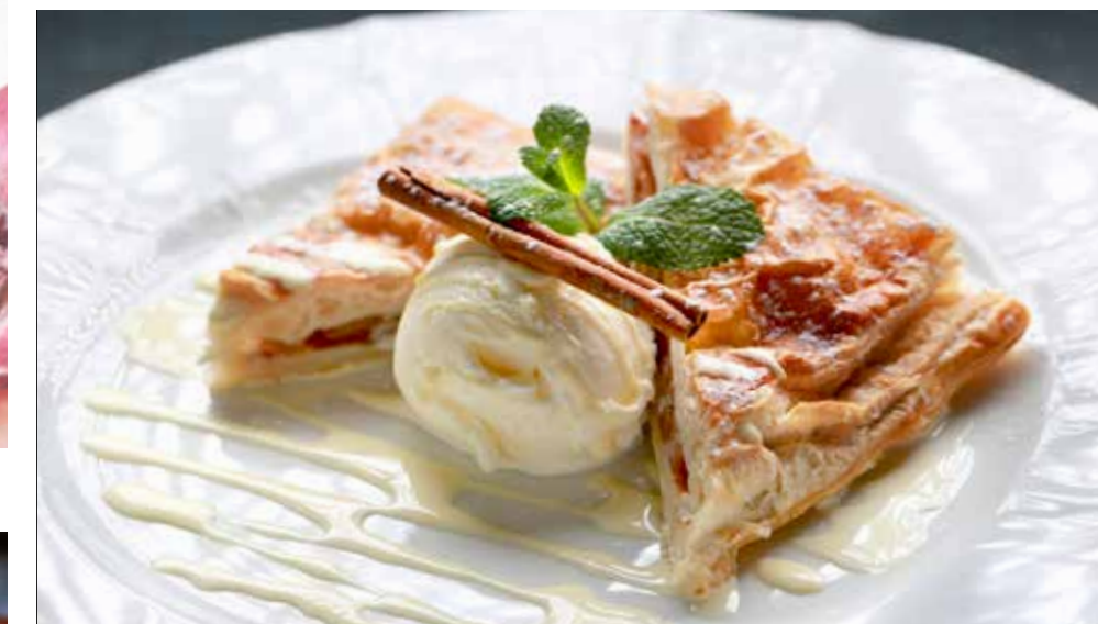
ЯБЛОЧНЫЙ ШТРУДЕЛЬ с ванильным мороженым 295 р