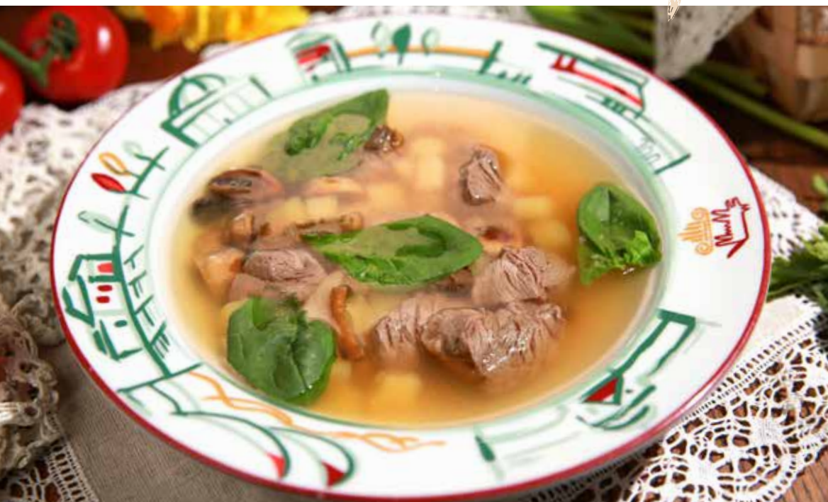
Zuppa Bollito Misto насыщенный суп с говядиной, картофелем и шпинатом 355₹