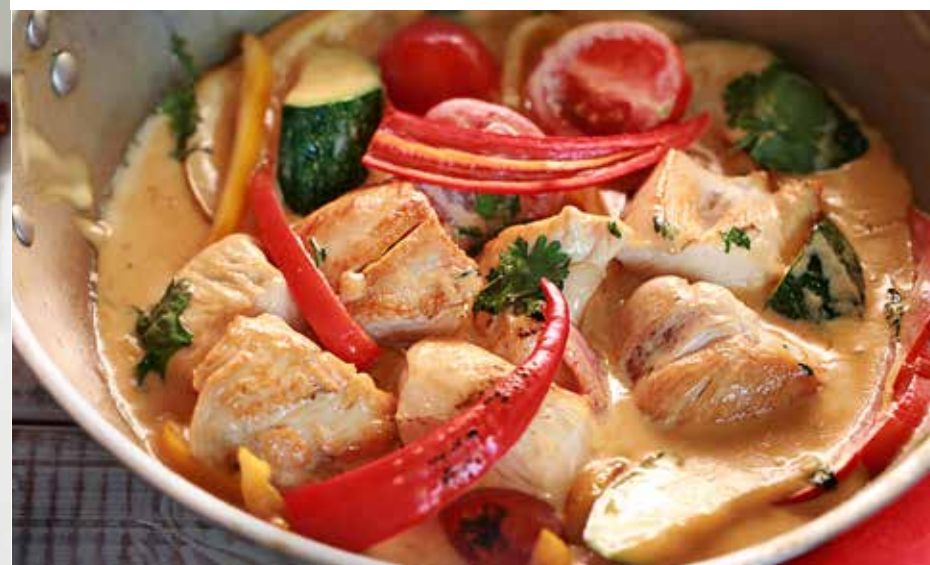
ПОЛЛО АЛЬ ФОРНО куриное филе в сливочном соусе с цукини, сладким перцем и кинзой