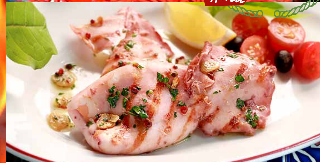
КАЛЬМАРЫ НА ГРИЛЕ в ароматном масле