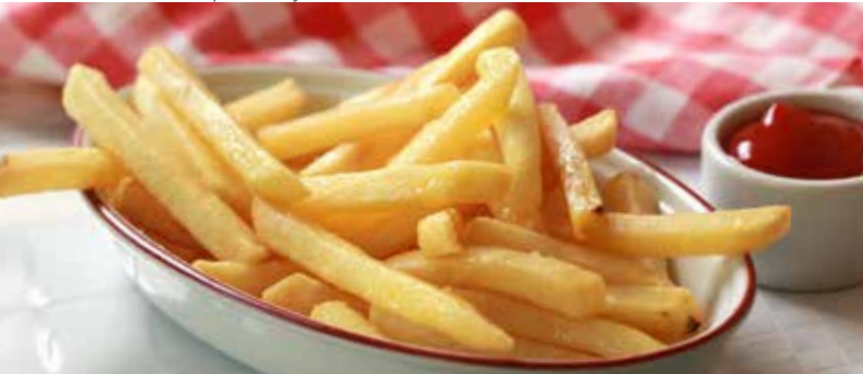
КАРТОФЕЛЬ ФРИ 225₹