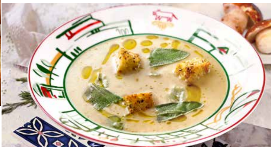
Крем-суп с белыми грибами грибной крем-суп с хрустящими сухариками 345₹