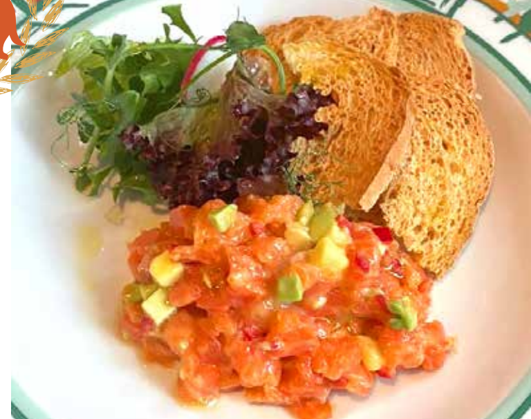
ТАРТАР ИЗ ЛОСОСЯ с авокадо, кростини в медово-горчичном соусе 525р