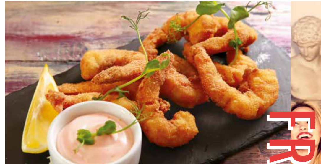
ГАМБЕРО ФРИТТО 545р тигровые креветки в панировке с соусом Капри