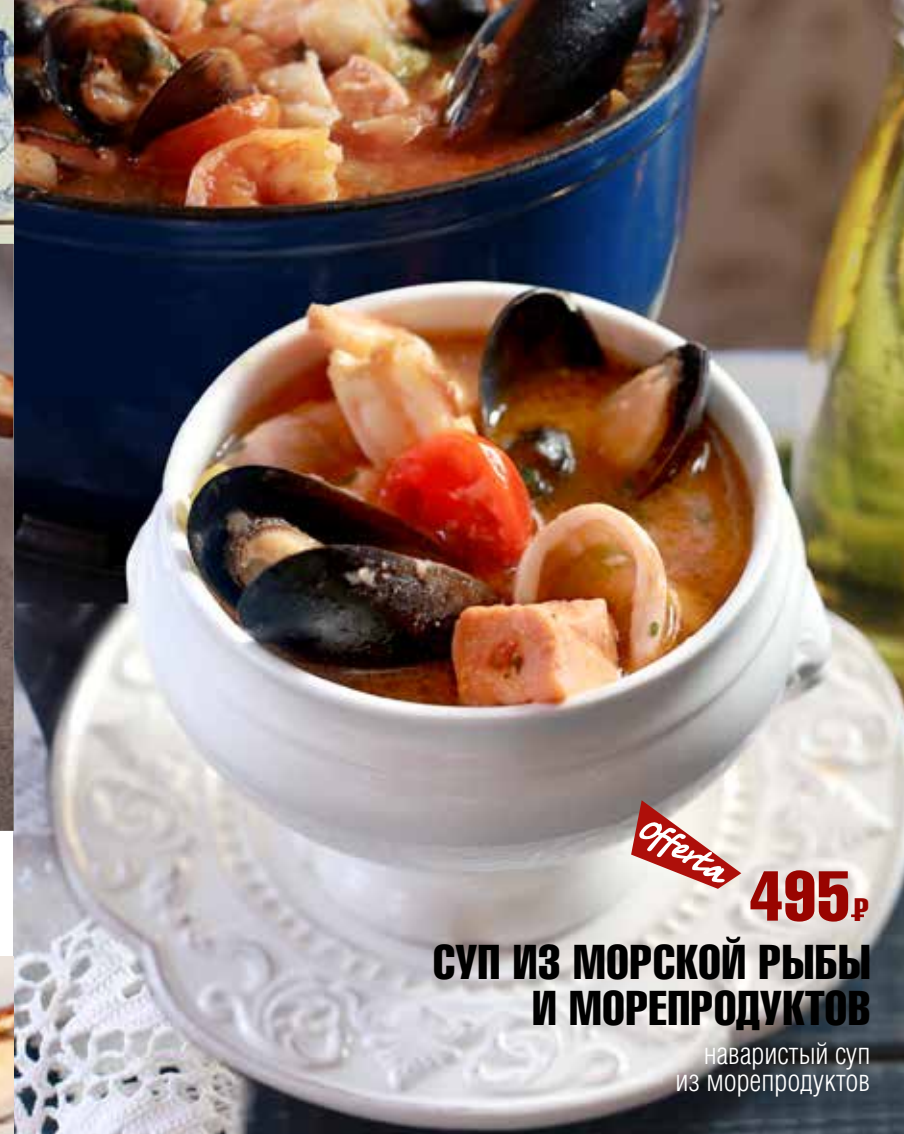
СУП ИЗ МОРСКОЙ РЫБЫ И МОРЕПРОДУКТОВ наваристый суп из морепродуктов 495₹ offerta