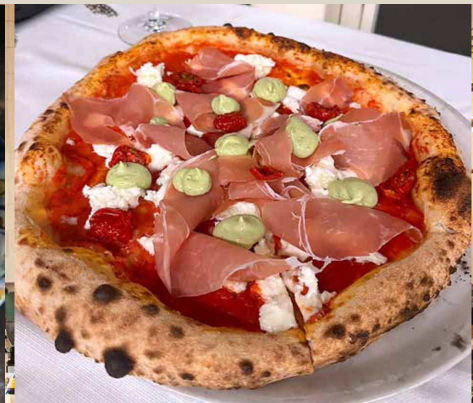
ПИЦЦА ГУРМЕ С ПРОШУТТО страчателлой, муссом из авокадо и вялеными томатами 495 р