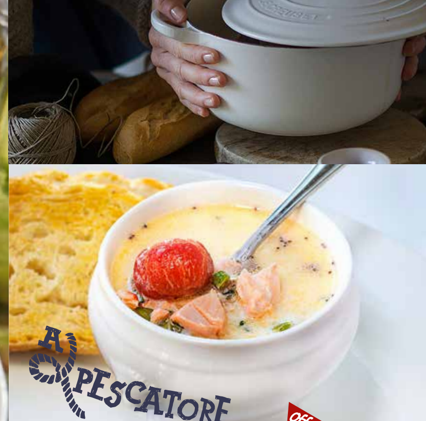
Zuppa di Salmone сливочный суп с лососем, нежной треской, помидорами черри, картофелем и пряными травами 385₹ offerta