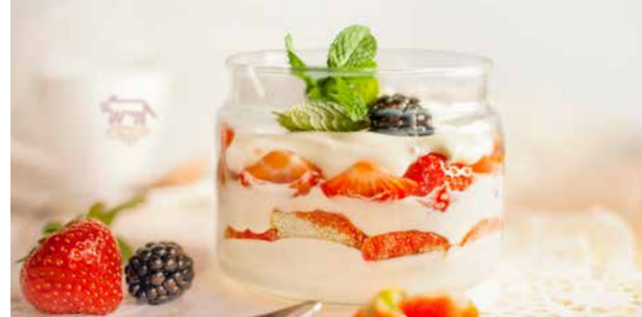
КЛУБНИЧНОЕ ТИРАМИСУ с нежным маскарпоне 355 р