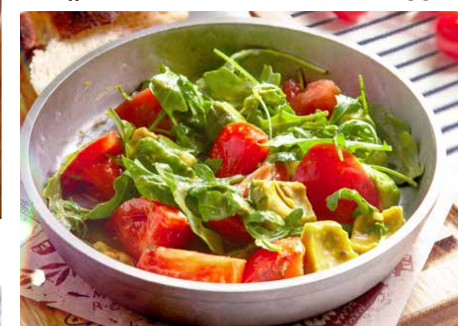
САЛАТ ИЗ АВОКАДО 435₽ авокадо, бакинские томаты с зеленью в горчично-медовом соусе