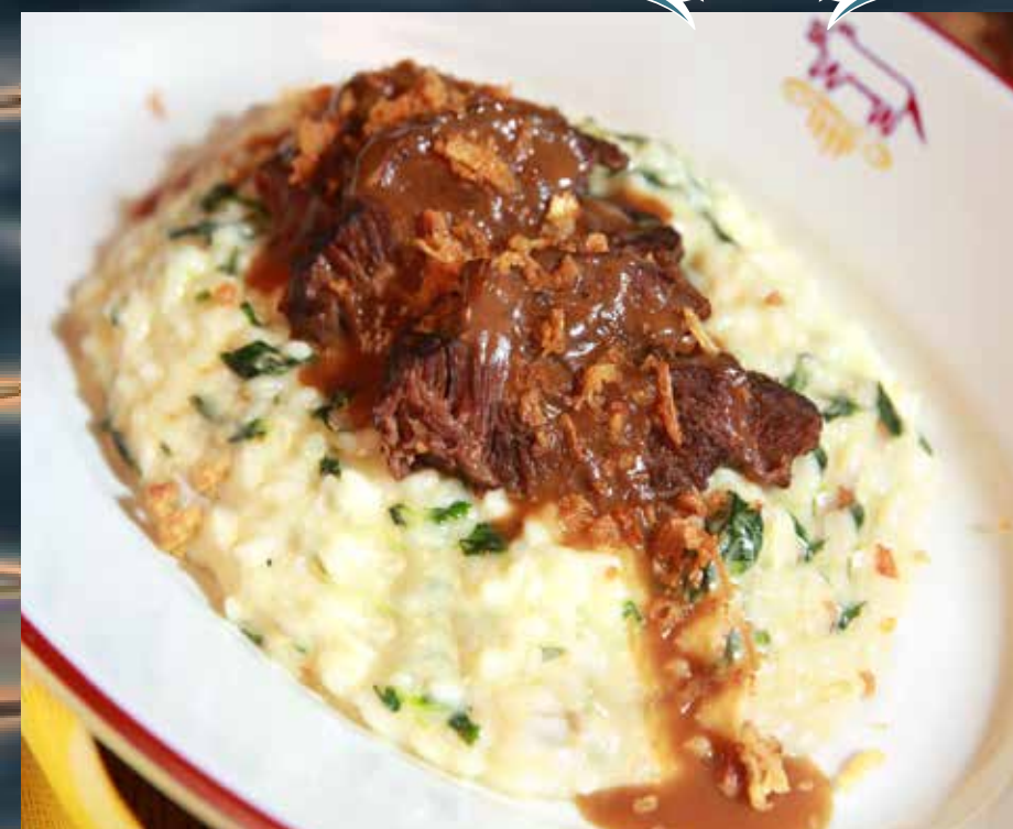
РИЗОТТО С НЕЖНЫМИ ТОМЛЕННЫМИ ГОВЯЖЬИМИ ЩЁЧКАМИ со шпинатом