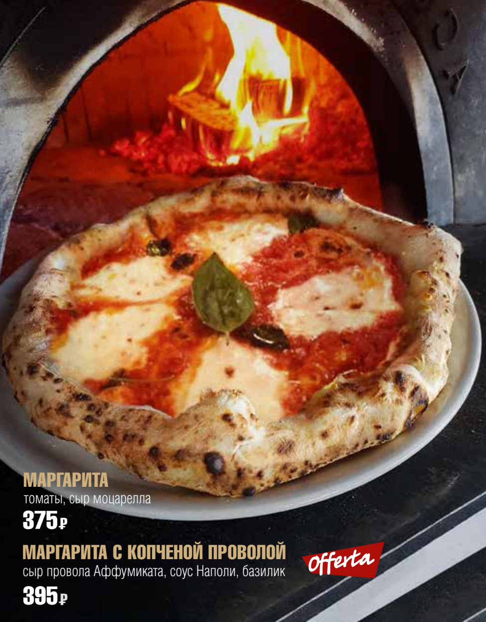
МАРГАРИТА томаты, сыр моцарелла 375 р