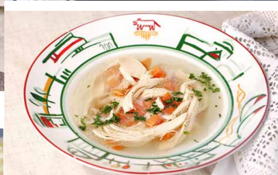
Куриный суп классический куриный суп 295₹