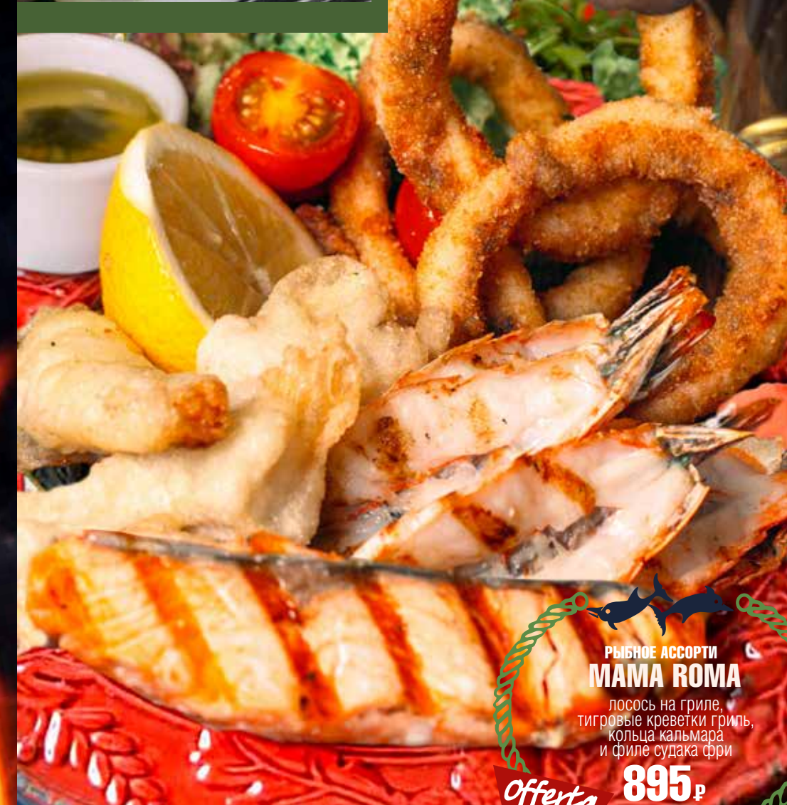
РЫБНОЕ АССОРТИ МАМА РОМА лосось на гриле, тигровые креветки гриль, кольца кальмара и филе судака фри