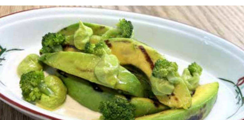
АВОКАДО НА ГРИЛЕ 345₹ с соусом из авокадо, киви и брокколи