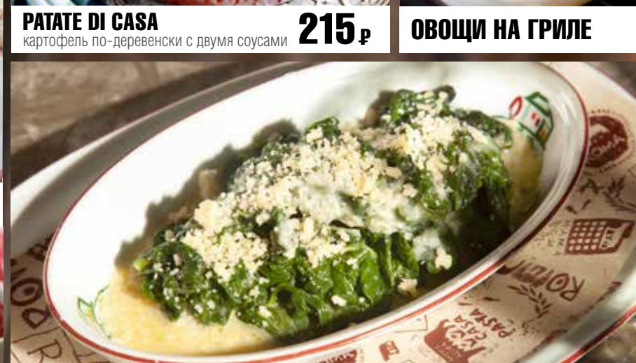
НЕЖНЫЙ ШПИНАТ С ПАРМЕЗАНОМ 325₹ обжаренный на сливочном масле