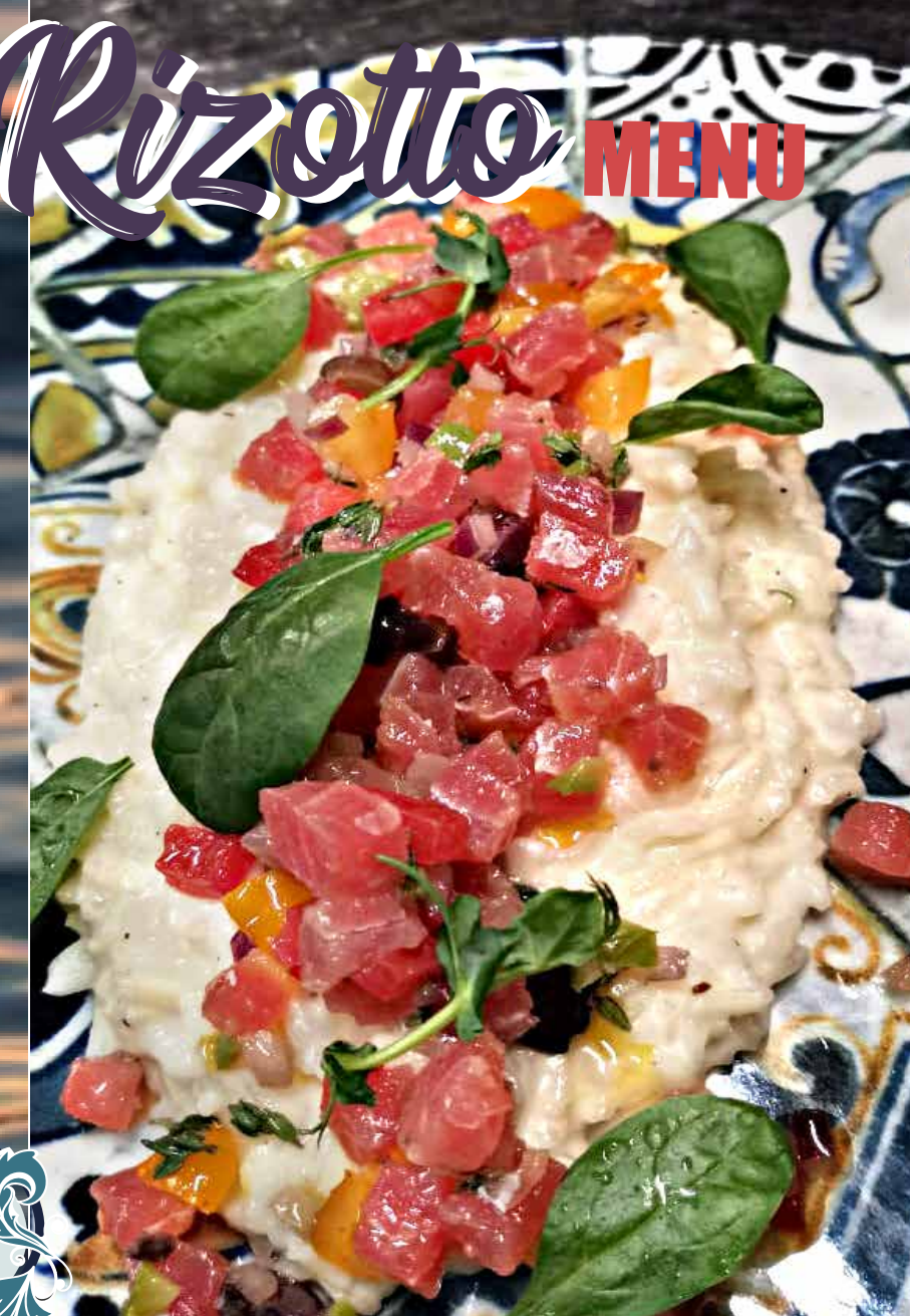
СЛИВОЧНОЕ РИЗОТТО С ТАРТАРОМ ИЗ ТУНЦА