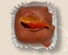
Молочный шоколад с абрикосом