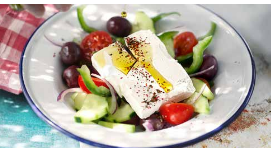
ГРЕЧЕСКИЙ САЛАТ 425₽ сладкий перец, огурцы, помидоры черри, красный лук, сицилийские бурые оливки, сыр фета, оливковое масло