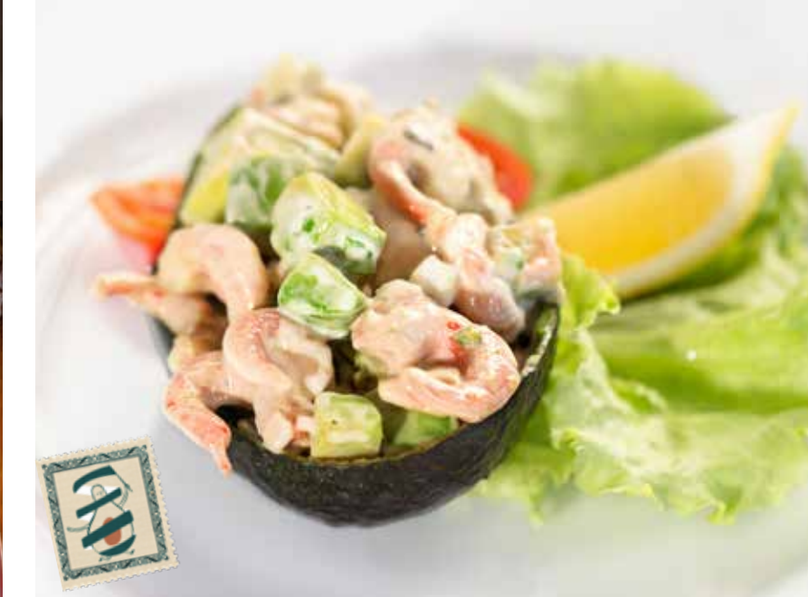
АВОКАДО С КРЕВЕТКАМИ 495₽