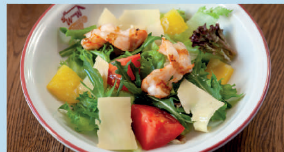
ОВОЩНОЙ САЛАТ с тигровыми креветками, черри, болгарским перцем и пармезаном