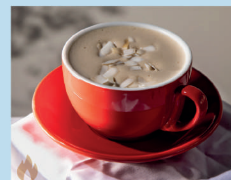
ALL COCONUT RAF