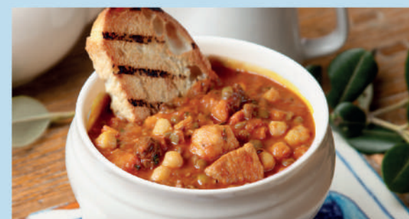
СУП-ГУЛЯШ ПО-ТОСКАНСКИ мясной суп с говядиной, свининой, куриным филе, овощами и нутом