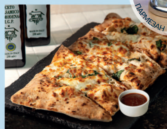
ФОКАЧЧА ЧЕТЫРЕ СЫРА