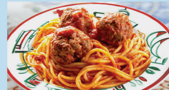
ПАСТА БОЛПЕТТИ говяжьи тефтели, соус болоньезе