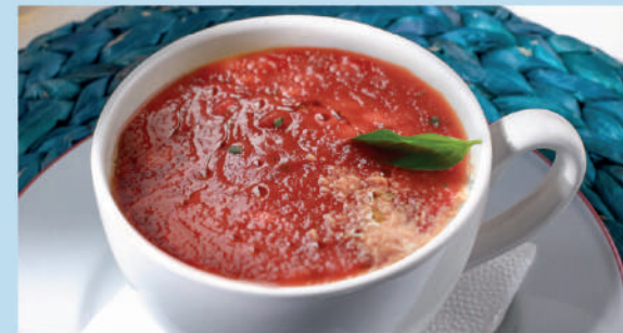
ТОМАТНЫЙ СУП с сыром моцарелла