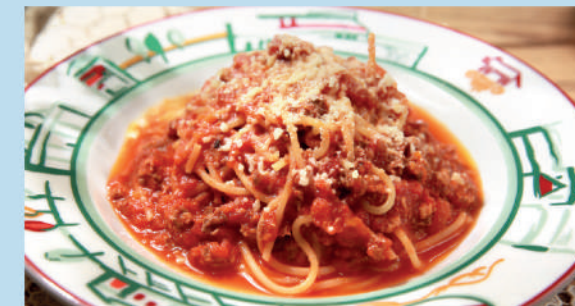
СПАГЕТТИ БОЛОНЬЕЗЕ с мясным фаршем и соусом Наполи