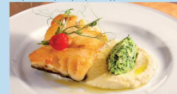
БЕЛАЯ РЫБА С НЕЖНЫМ ПЮРЕ и тартаром из брокколи