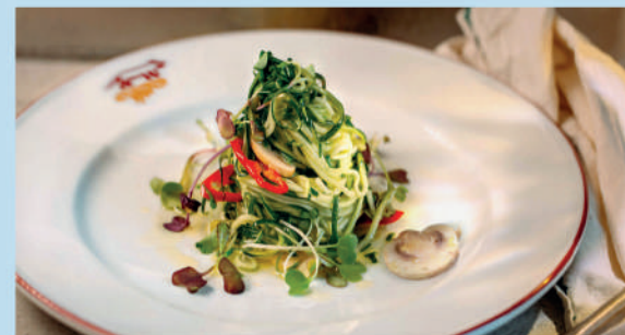
САЛАТ ИЗ ЦУККИНИ цуккини, шампиньоны, оливковое масло, перец чили