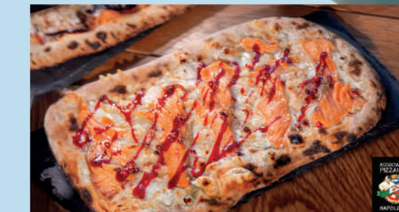
ФОКАЧЧА С КОПЧЕНЫМ ЛОСОСЕМ, БРУСНИЧНЫМ СОУСОМ И РОЗОВЫМ ПЕРЦЕМ