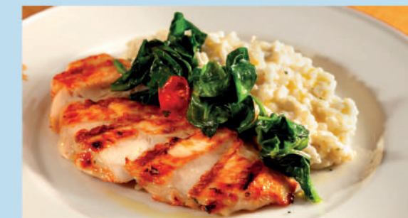
КУРИНОЕ ФИЛЕ НА ГРИЛЕ со сливочным ризотто шпинатом и черри