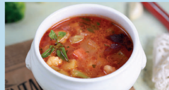
МИНЕСТРОНЕ овощной пряный суп с соусом Наполи