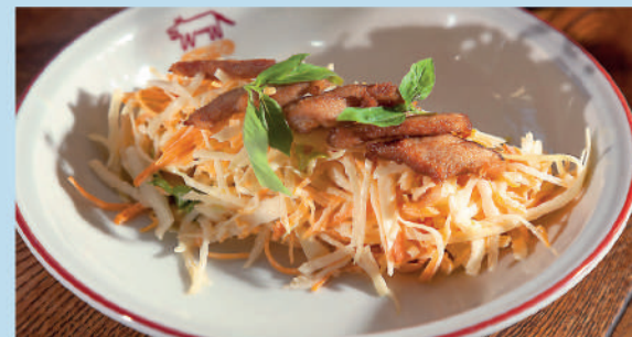
КУОЛ СЛОУ С КУРИЦЕЙ ФРИ горчицей и салатом Куол Слоу