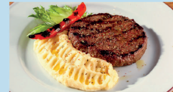
БИСТЕККА НА ГРИЛЕ с нежным пюре, зеленью и перцем чили