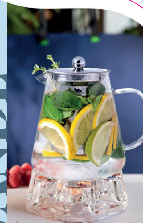
ЧАЙ FITNESS МОЈИТО мята, лайм, лимон, вода Байкал