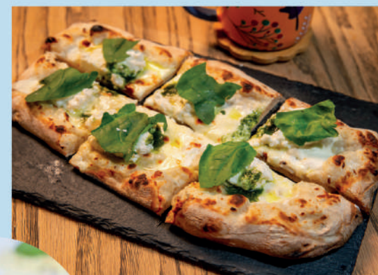
ФОКАЧЧА С РИКОТТОЙ, ШПИНАТОМ, ПЕСТО И ТРЮФЕЛЬНЫМ МАСЛОМ