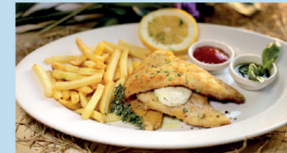
КОТОЛЕТТЕ ДИ ПОЛЛО АЛЛА МИЛАНЕЗЕ куриное филе в хрустящей панировке с соусом BBQ и картофелем фри