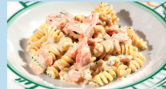
ФУЗИЛЛИ С КРАСНОЙ РЫБОЙ черри, шпинатом и сливочным соусом