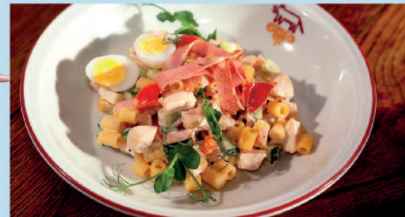
ИНСАЛАТА С МОРТАДЕЛЛОЙ пастой дитали, томатами и яйцом