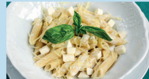
ПЕННЕ ТРИ СЫРА со сливочным соусом