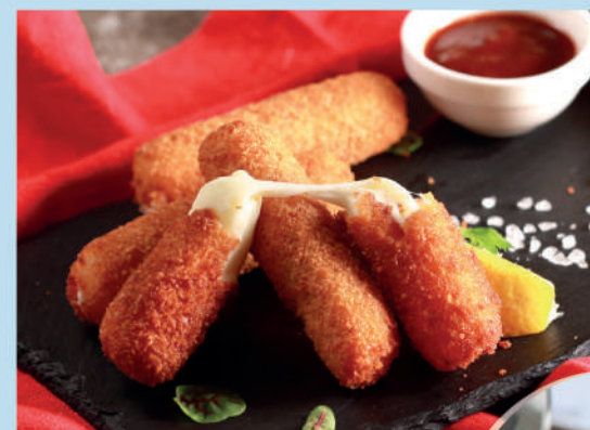
НЕЖНАЯ МОЦАРЕЛЛА В ХРУСТЯЩЕЙ КОРОЧКЕ