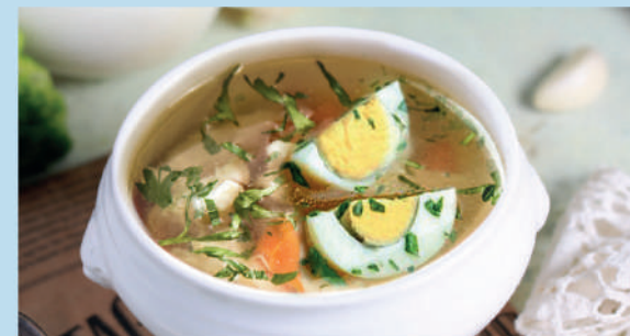
КУРИНЫЙ СУП классический куриный суп с отварным яйцом