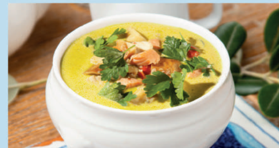
СЛИВОЧНЫЙ СУП С РЫБОЙ