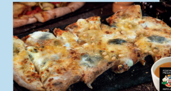
ФОКАЧЧА С СЫРОМ ГОРГОНЗОЛА, КЕДРОВЫМИ ОРЕШКАМИ И МЁДОМ