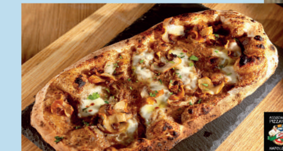
ФОКАЧЧА С ГРИБАМИ И МОЦАРЕЛЛОЙ