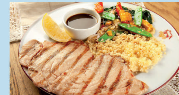
СТЕЙК ТУНЦА НА ГРИЛЕ С КУСКУСОМ салатом по-азиатски и соусом Mama Roma