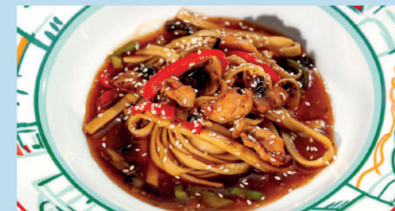
ПАСТА WOK домашняя лапша с курицей, грибами, болгарским перцем и соусом Терияки